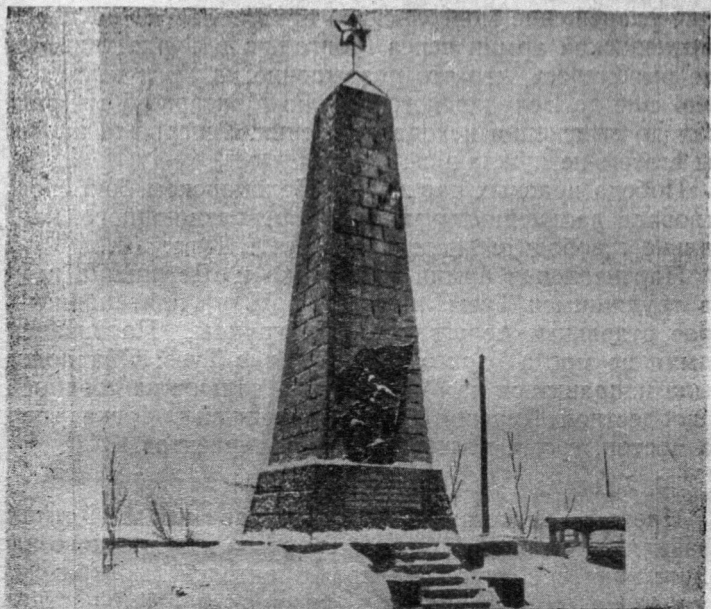
Обелиск в память красным партизанам, погибшим в Белоцарском бою в 1919 г. Установлен в г. Кызыле на берегу Енисея.