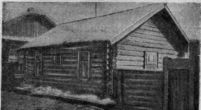
Помещение штаба партизанской армии Кравченко и Щетинкина в г. Кызыле в 1919 г. (ул. Ленина, 49).