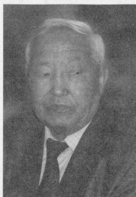
Александр ДАРЖАЕВ, Народный писатель Тувы