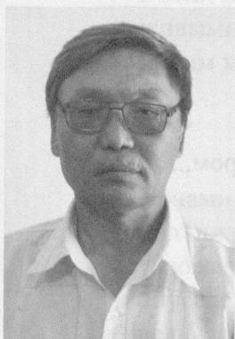
Эдуард МИЖИТ, Народный писатель Тувы