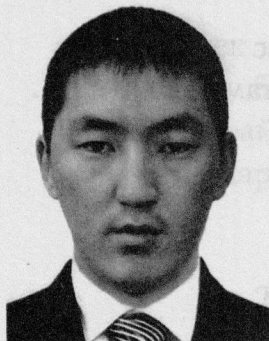
Байыр-Мөңге Б А Н Д А Н