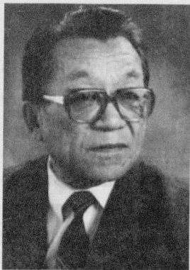
Кызыл-Эник К У Д А Ж Ы