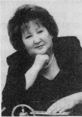
Наталья ХАРЛАМПЬЕВА, Саха (Якутияның) Улустуң шүлүкчүзү