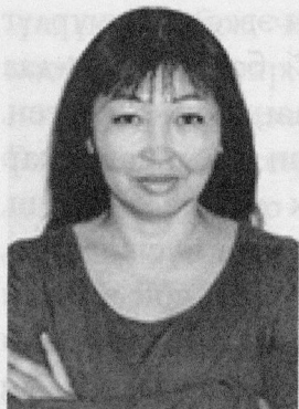
Саяна Ө Н Д У Р