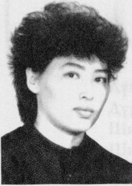
Чечек К Е Н Д И В А Н