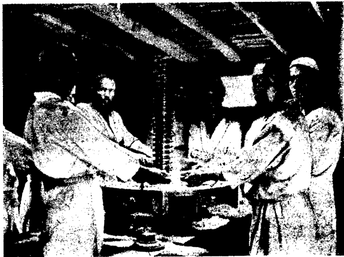
Кашгар. Прессовка шерсти, предназначенной к экспорту в СССР.

На ряду с СССР на кашгарском рынке выступают Индия, Афганистан и внутренний Китай. С ростом нашего экспорта и конкуренции наших товаров, экспорт этих стран становится все меньше и меньше. Состав экспорта этих стран (особенно Индии) в последние годы под давлением нашей конкуренции значительно изменился. Не имея возможности вследствие дороговизны фрахта конкурировать с нашими основными экспортными товарами, экспортеры других стран заменяют эти виды экспорта другими, которым не угрожает конкуренция наших товаров. Так индусы вытесняемые с рынка хлопчатобумажных тканей (в 1927 г. из Индии хлопчатобумажных тканей вывезено на 144 тыс. кашгарских лап, а в 1928 г. всего на 97 тыс. кашгарских лап) частично восполняют свои потери за счет увеличения завоза шелковых тканей. Экспорт шелковых тканей из Индии в 1927 г. выразился в сумме 108.974 кашгарских лап, а в 1928 г. он достиг 135.995 кашгарских лап. Точно так же отмечается увеличение завоза шелковых тканей и из внутреннего Китая: в 1927 г. он составлял 434.250 кашгарских лап, в 1928 г. он вырос до 491.500 кашгарских лап. Общая сумма завоза шелковых тканей в 1928 г. достигла сравнительно большой величины—625.455 кашгарских лап. Полное отсутствие вывоза шелковых тканей из СССР отдаст целиком рынок шелковых тканей в руки иностранцев.