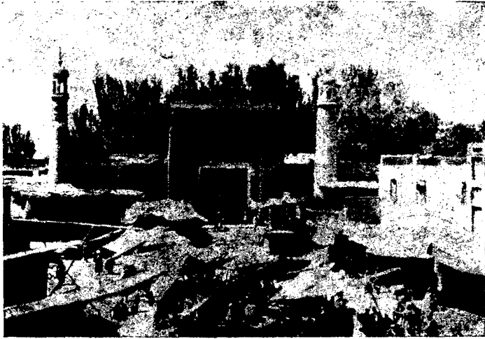
Кашгар. Общий вид базара.

Все это не может не сказаться на успешности работы по изучению как экономики страны, так и конъюнктуры кашгарского