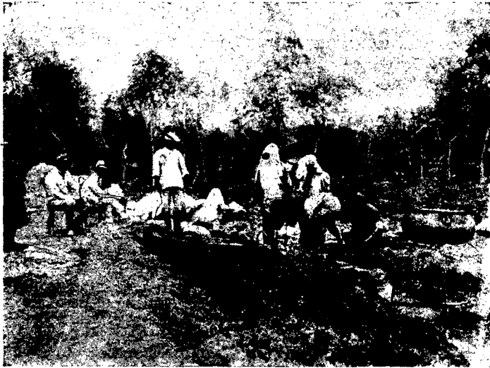
Мойка шерсти в Кашгаре.

Выход на внешний рынок шерстей, ковров, шелка-сырца и других видов кашгарского сырья в 1930 году, очевидно, несколько возрастет по сравнению с выходом истекшего года. Таким образом, общая конъюнктура народного хозяйства Кашгарии очевидно не может быть заметно лучше по сравнению с конъюнктурой предшествующего года.