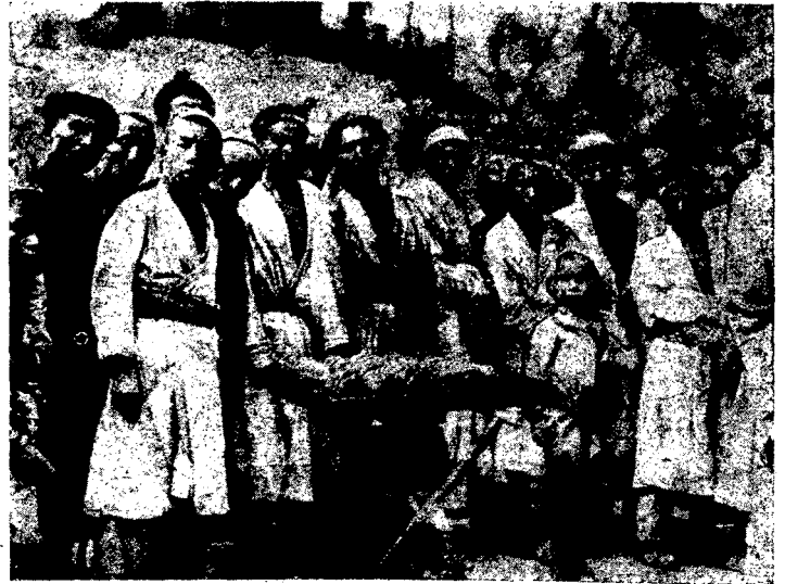
Кашгар. Типы местных жителей на базаре.

Рост товарного выхода сырья повлек за собой довольно значительный рост внешней торговли Кашгарии. Как мы увидим ниже, общий оборот внешней торговли Кашгарии в истекшем году на 50% больше по сравнению с оборотом 1927—28 г. Сохранить этот темп роста торговли в будущем году для Кашгарии вряд ли будет