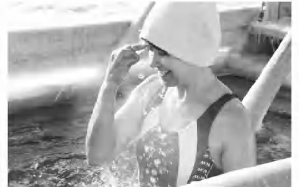
Во имя Отца и Сына и Святого Духа!