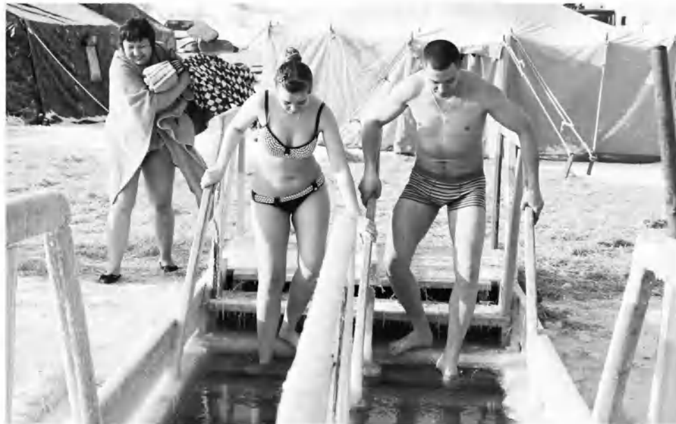
Вместе, дружно, всей семьей!