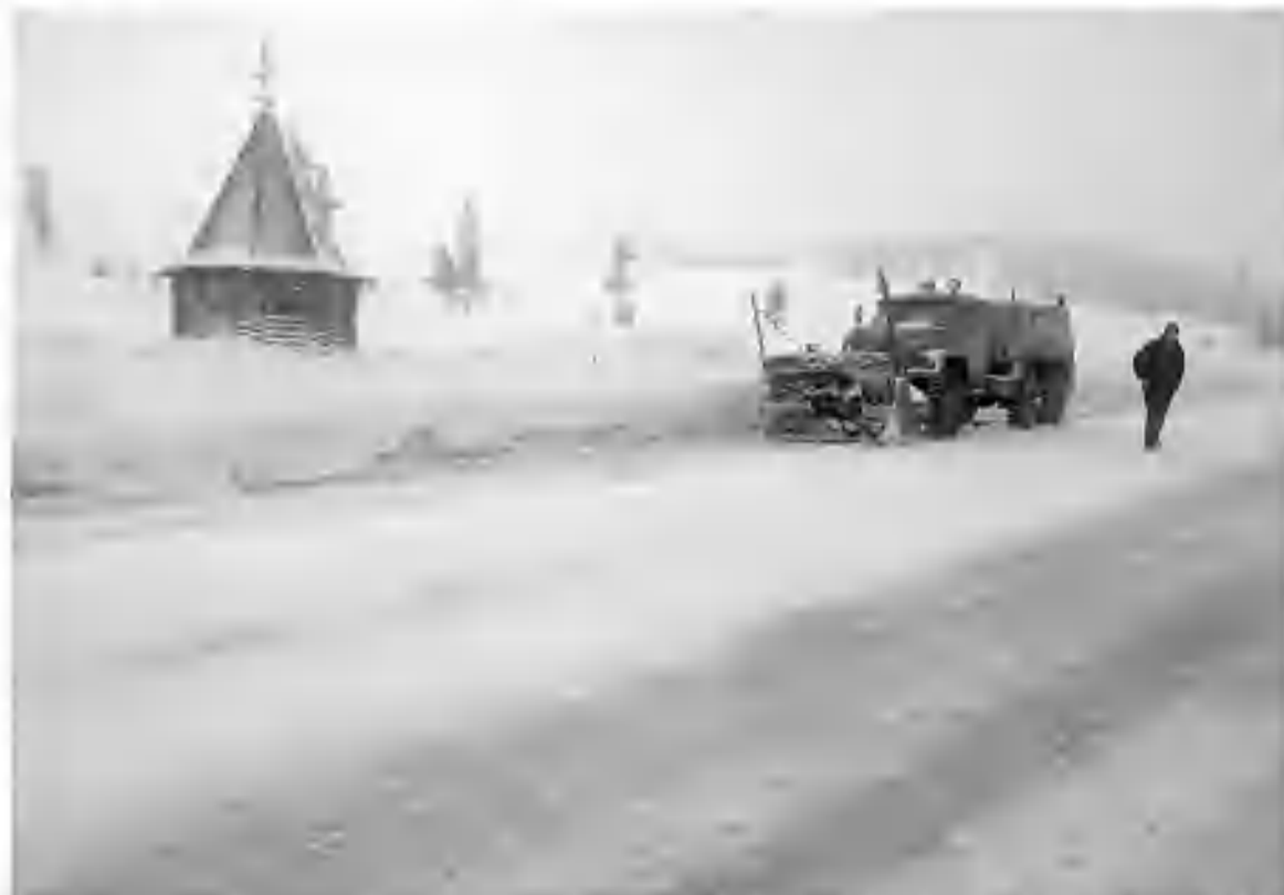
Очистка проезжей части. Трасса М-54