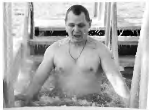
Мужчины оказались более эмоциональными