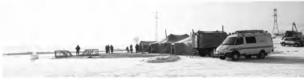
На Вавилинском затоне было все подготовлено для желающих искупаться