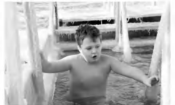
Дети не уступали взрослым