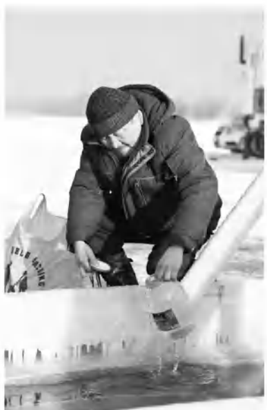
Некоторые люди не купались, но набирали воду из купели!