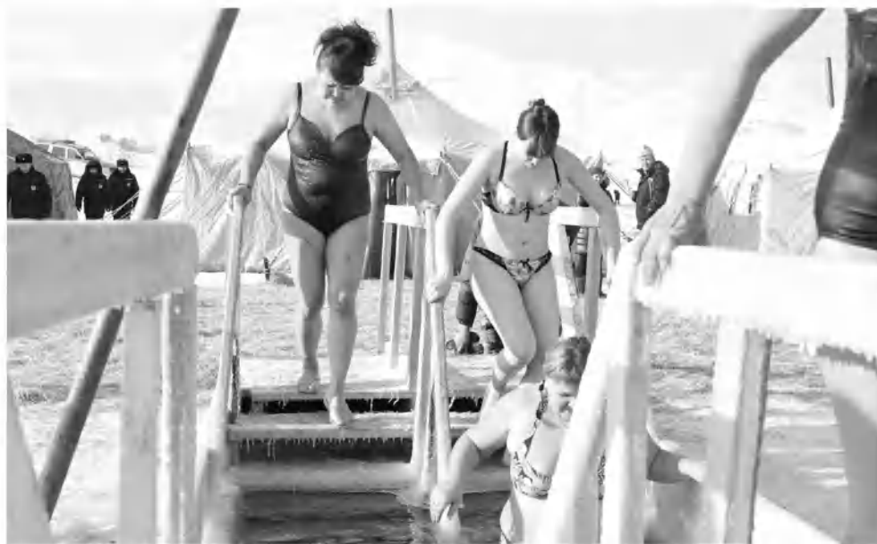
Кто-то не только три раза окунался, но и в купель трижды заходил