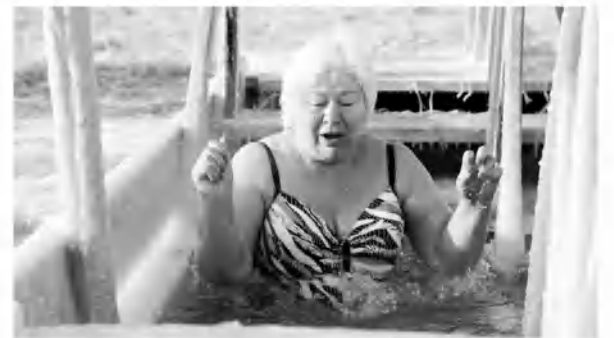
Купание зимой в первый раз