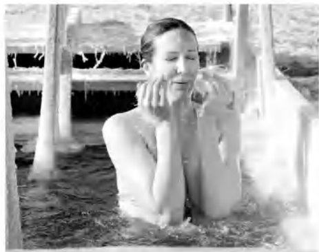
Девчонки держались мужественно