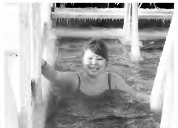
С улыбкой, весело и задорно