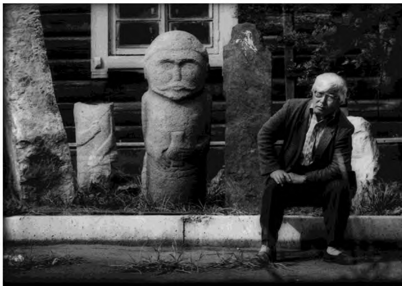
Во дворе старого музея.

по теме «Проблемы этнографического изучения тувинского шаманизма. По материалам шаманского фольклора». М. Б. Кенин-Лопсан как этнограф, шамановед стал автором более 10 научных изданий.