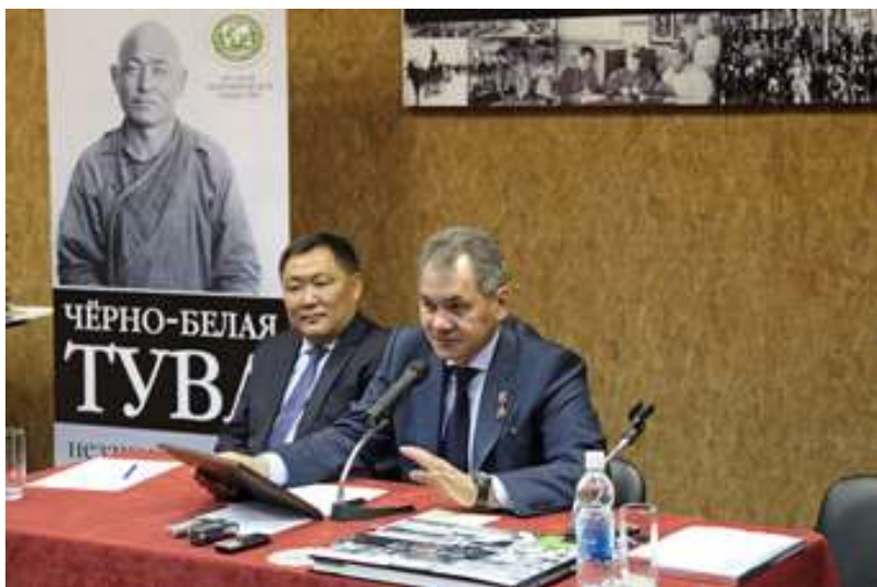
Презентация книги «Черно-белая Тува», 21 ноября 2011 г.