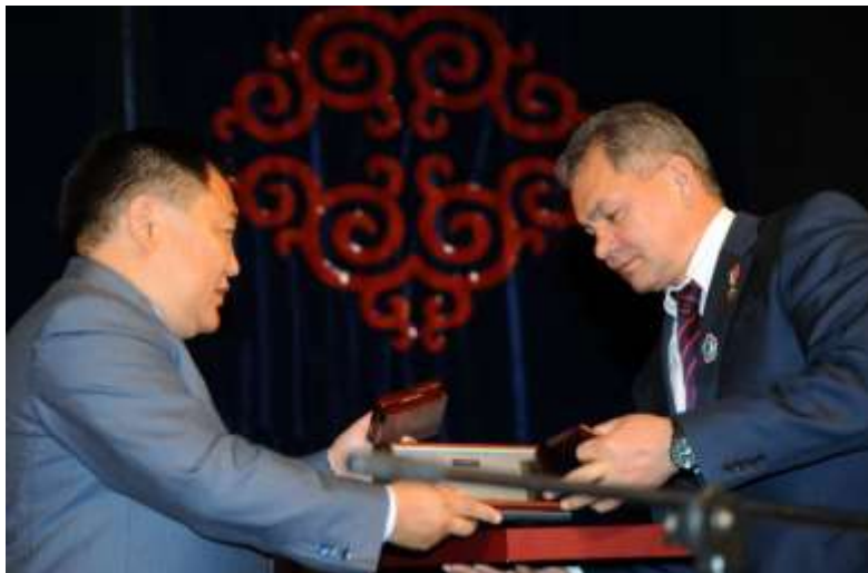
С Главой Правительства Республики Тыва Ш. В. Кара-оолом, 2010 г.