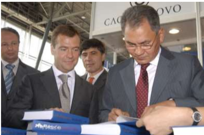
С Дмитрием Медведевым, 2010 г.