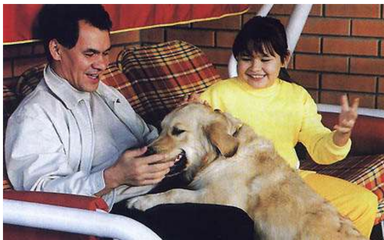
Сергей Шойгу с младшей дочерью.