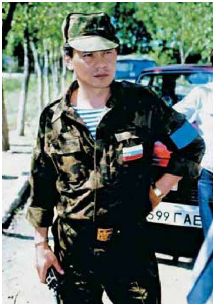
Председатель Государственного комитета при Президенте РСФСР по делам гражданской обороны, чрезвычайным ситуациям и ликвидации последствий стихийных бедствий С. К. Шойгу. Южная Осетия, 1992 год.