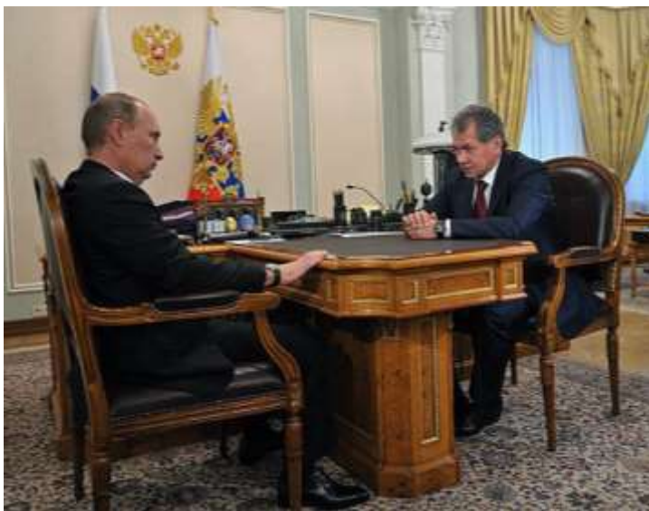
Сергей Шойгу на встрече с Президентом Российской Федерации Владимиром Путиным, 2012 г.