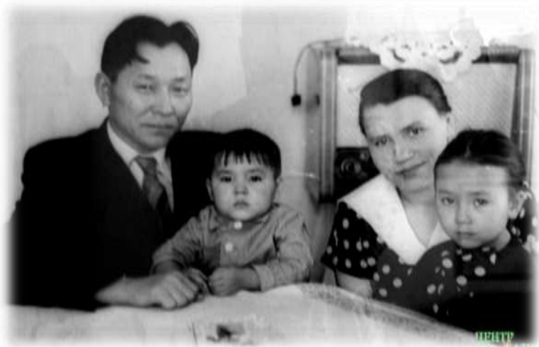
Родители С. К. Шойгу и старшая сестра.