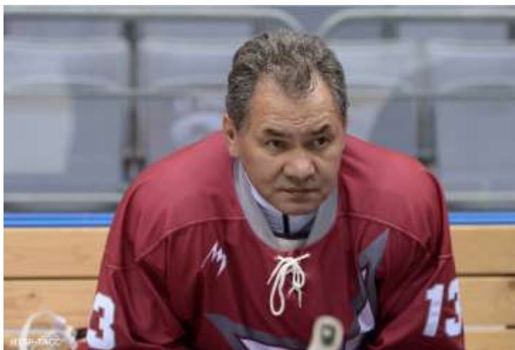
С. Шойгу является игроком ХК «ЦСКА» – «Спартак», 2011 г.