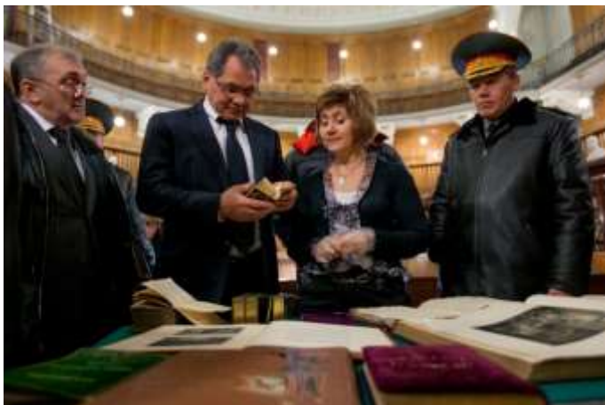
Посещение Военной исторической библиотеки Генерального штаба Вооруженных Сил Российской Федерации, 11 января 2013 г.