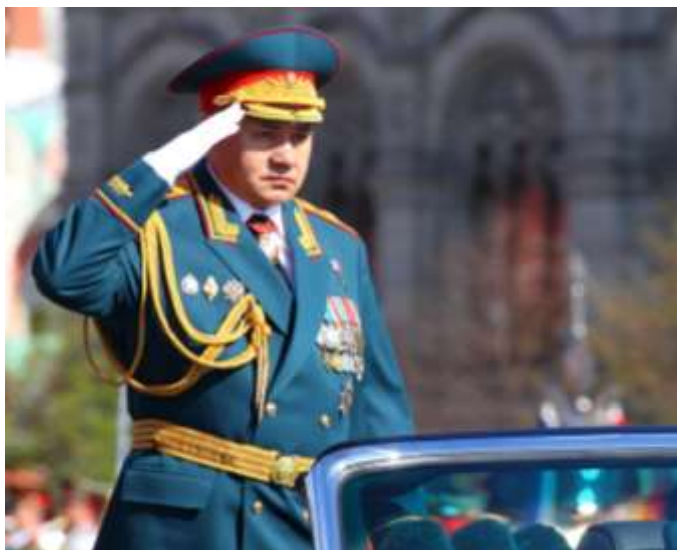
Министр обороны Российской Федерации Сергей Кужугетович Шойгу принимает парад Победы, 2013 г.