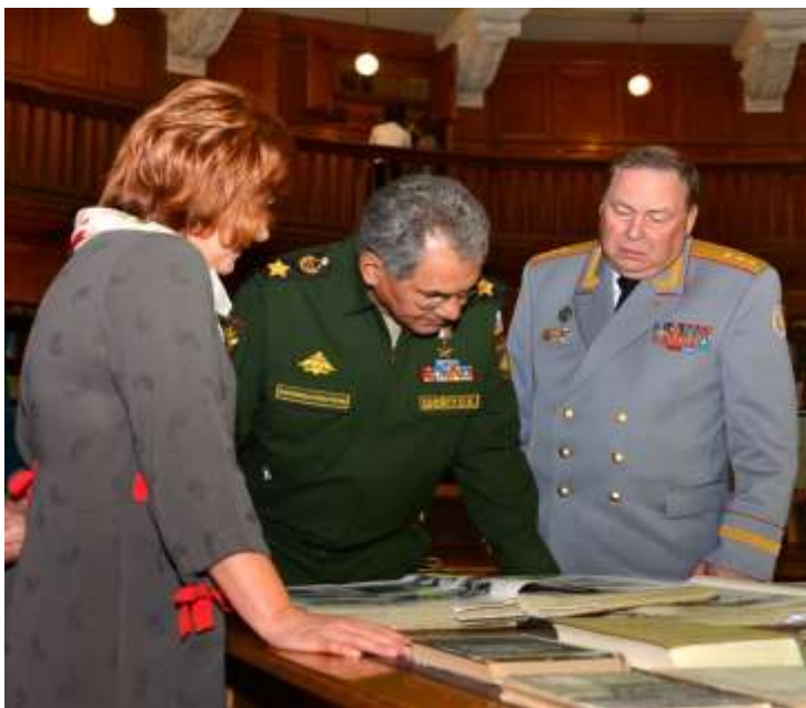
Посещение Военной исторической библиотеки Генерального штаба Вооруженных Сил Российской Федерации, 22 августа 2014 г.