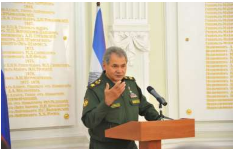
22 августа 2014 г. Георгиевский Зал штаба Западного Военного Округа (г. Санкт-Петербург).