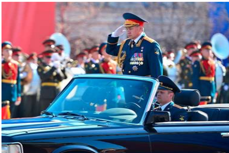
Парад Победы к 70-летию Великой Отечественной войны, 9 мая 2015 г.