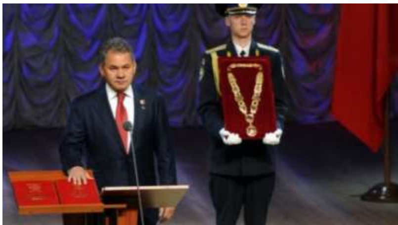
Инаугурация губернатора Московской области, 11 мая 2012 г.