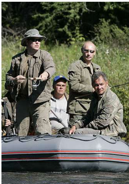
Владимир Путин, Сергей Шойгу и князь Монако Альбер II во время сплава по реке Енисей, Республика Тува, 2007 г.