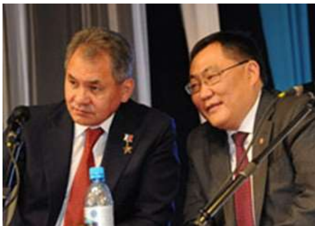
С. К. Шойгу с Председателем Правительства Республики Тыва Ш. В. Кара-оол, 2012 г.