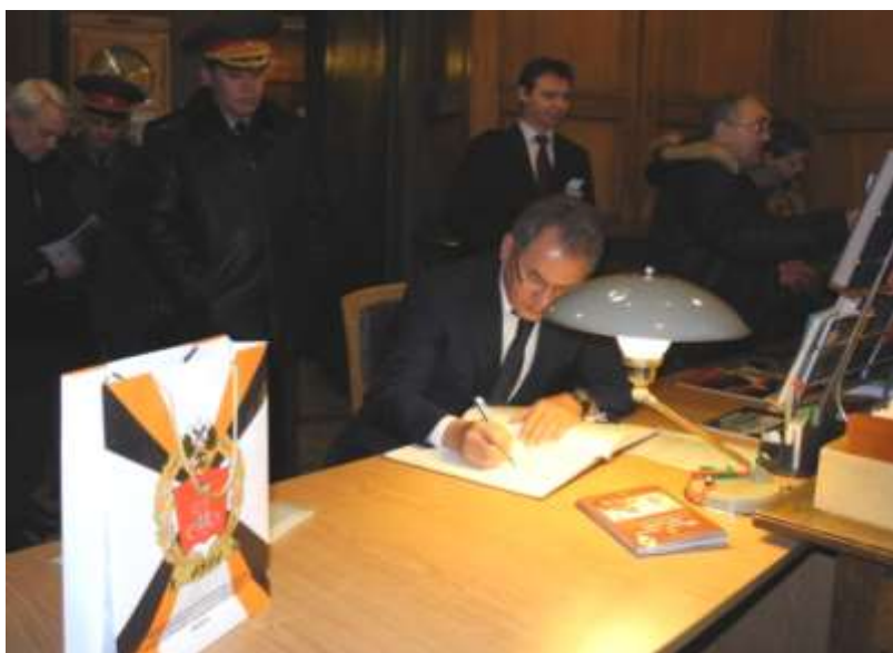
Парад Победы в Севастополе, 9 мая 2014 г.