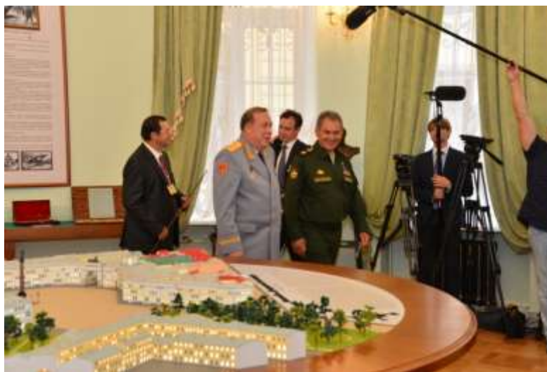
Открытие Военно-исторического зала в штабе Западного Округа, 22 августа 2014 г.