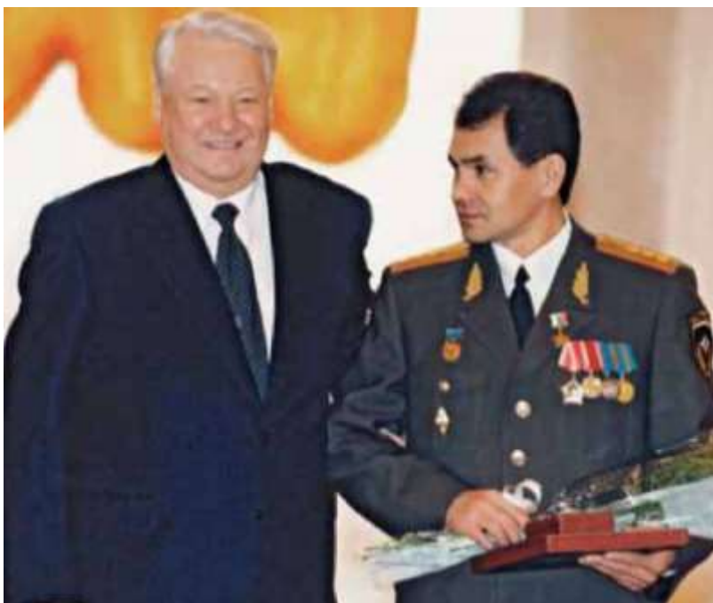
На вручении Золотой Звезды и Грамоты Героя России генерал-полковнику С. К. Шойгу первым Президентом Российской Федерации Б. Н. Ельциным, 1999 год.