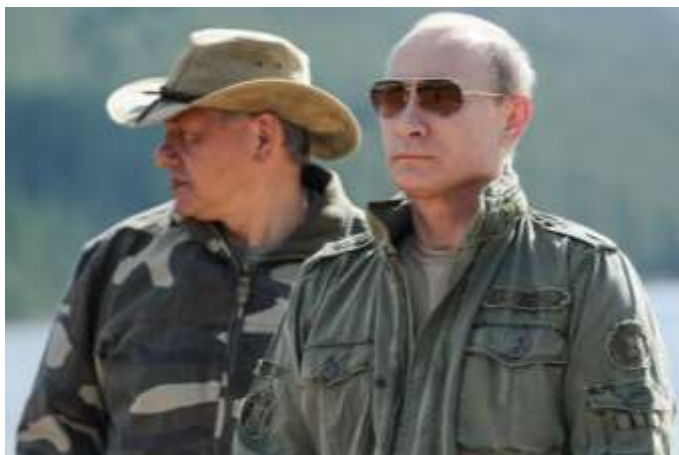
Во время рыбалки в Республике Тыва с Владимиром Путиным, 2012 г.