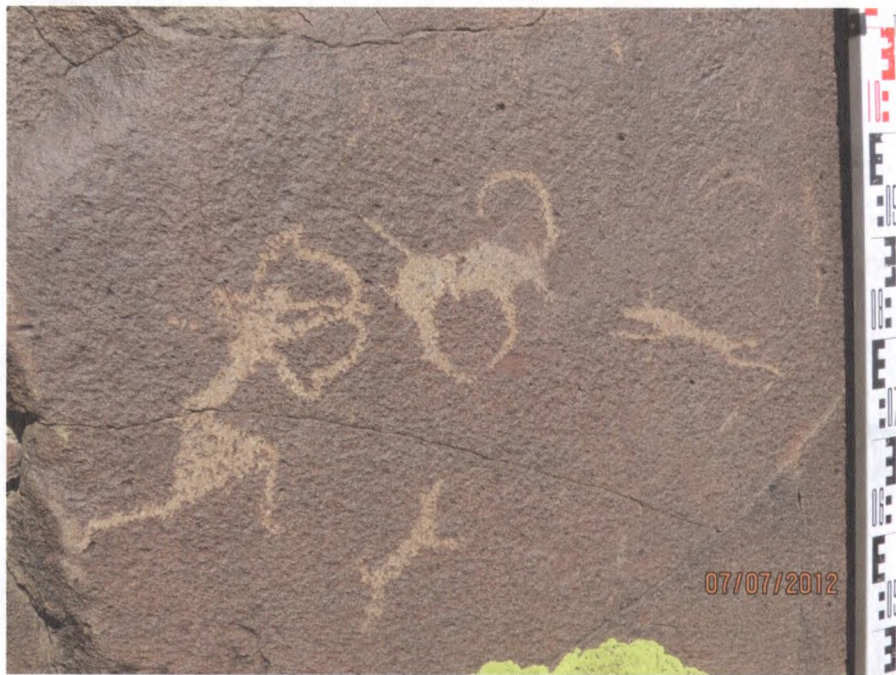
Фото 4. Петроглиф «Лучник» на скале горы Хорум-Даг в Дзун-Хемчикском кожууне