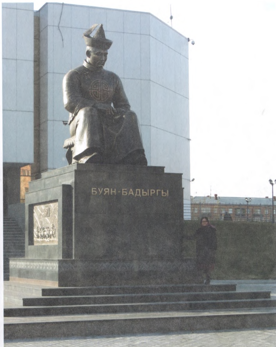
Фото 5. Памятник «Буян-Бадырғы» в г. Кызыле