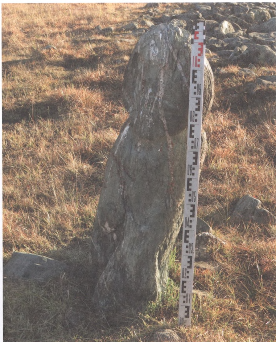
Фото 3. Кижикожээ в долине р. Хууректиг Сут-Хольского кожууна