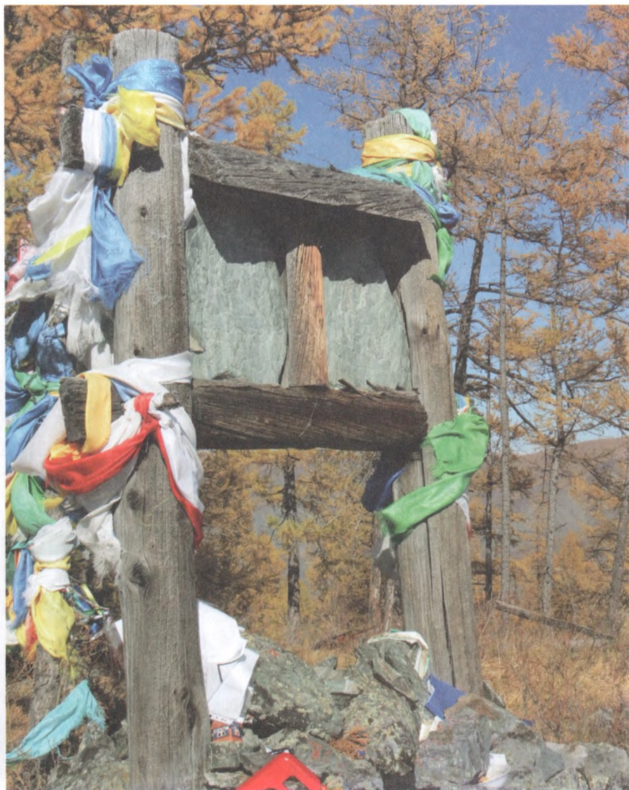
фото 1. Барельефы буддийских божеств на вершине горы Бурганныг-Даг в местечке Хууректиг в Сут-Хольском кожууне