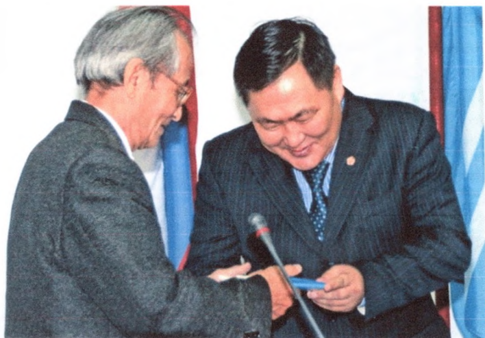
Присвоение звания «Народный писатель РТ» (2008 г.).