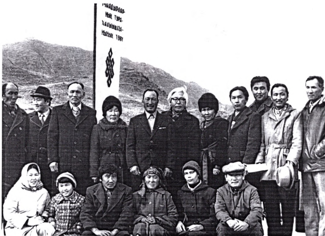
110-летие со дня восстания 60 богатырей. Местечко Оргу-Шол. (1993 г.).

Стихи читаются легко, на одном дыхании. Это достигается благодаря тому, что поэт всегда стремится к концентрации чувств в лирико-философском плане. Лаконизм, афористичность, живописность – характерные черты его неповторимой манеры. Ведь поэзия, как и всякое искусство, это – прежде всего, философия.