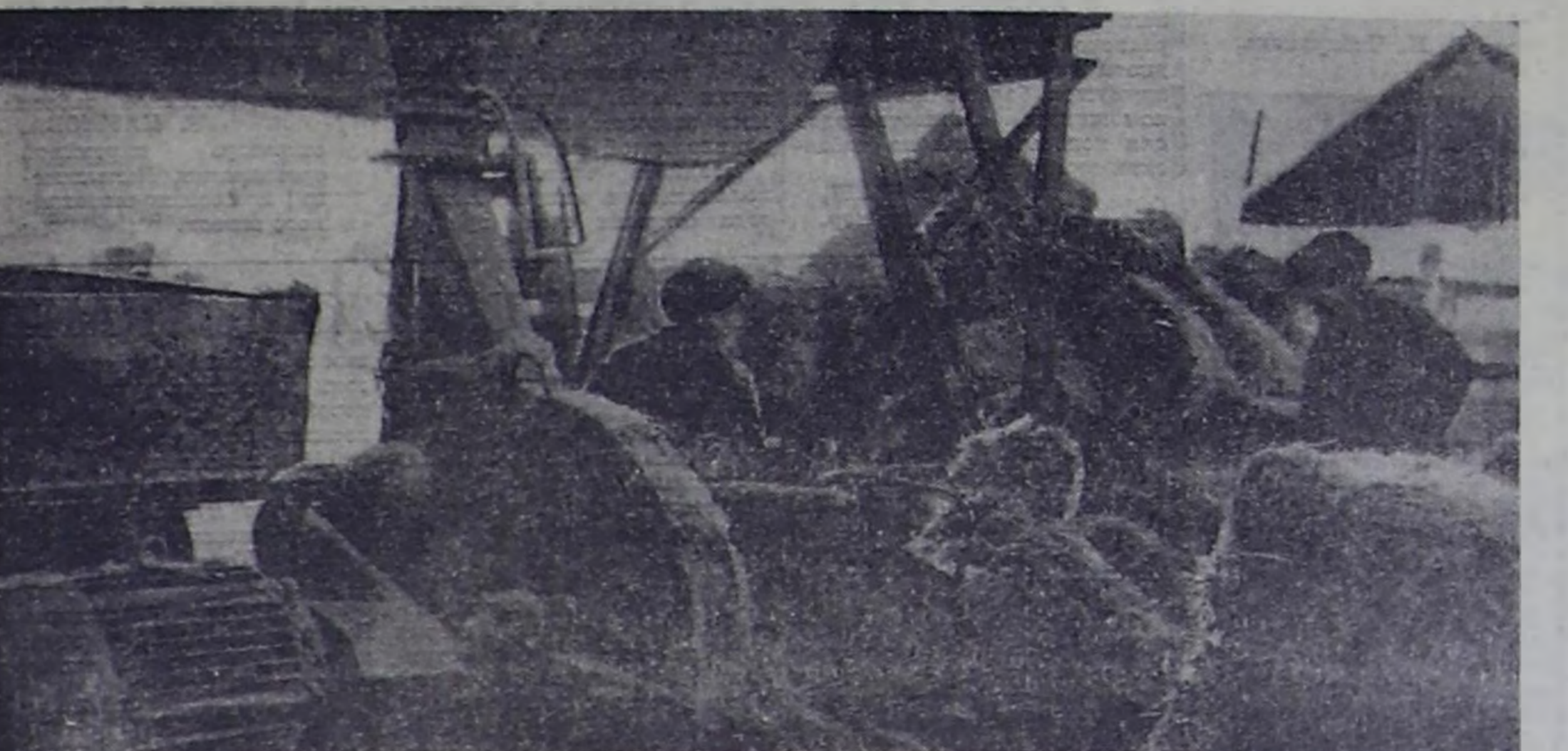
На снимке: кормовой пах совхоза «25 лет РККА».

зультатах. Пока продукция животноводческой отрасли обычно, хотя и выше хозяйства районного, что ее даже переработать план. Нынешнее повышение цен на молоко заготовлено в совхозах заготовлено новое количество трудоемких кормов. При нынешнем использовании кормов говорит пример совхозов «25 лет РККА», «Свобода труда», можно поднять продуктивность дойного стада и за счет этого выхода продукции. Значит, се себестоимость, что мы не делаем только плановым сортом. Решенье такой задачи под силу каждому коллективу молочно-товарной фермы.