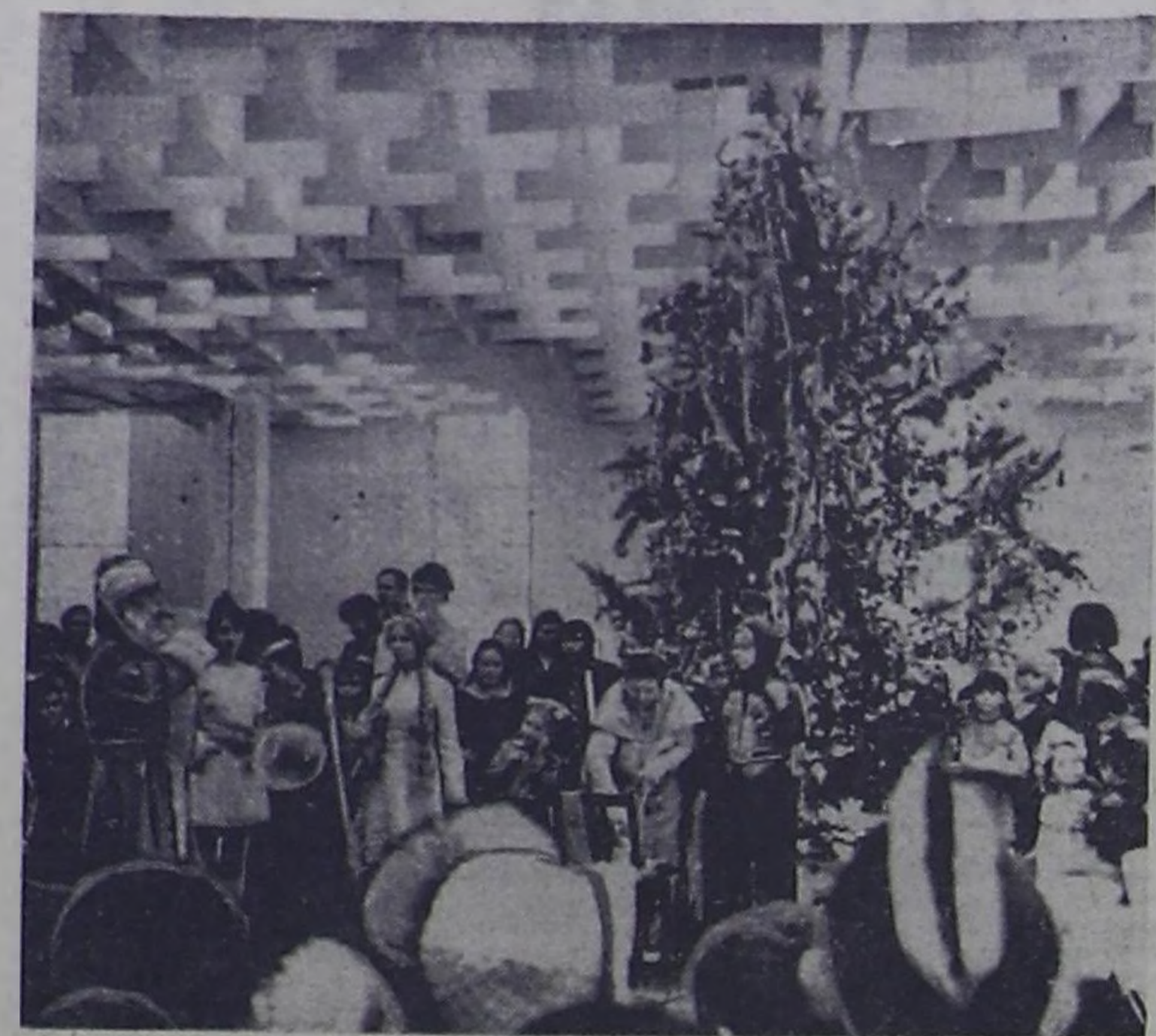
На новогодней елке в г. Кызыле.