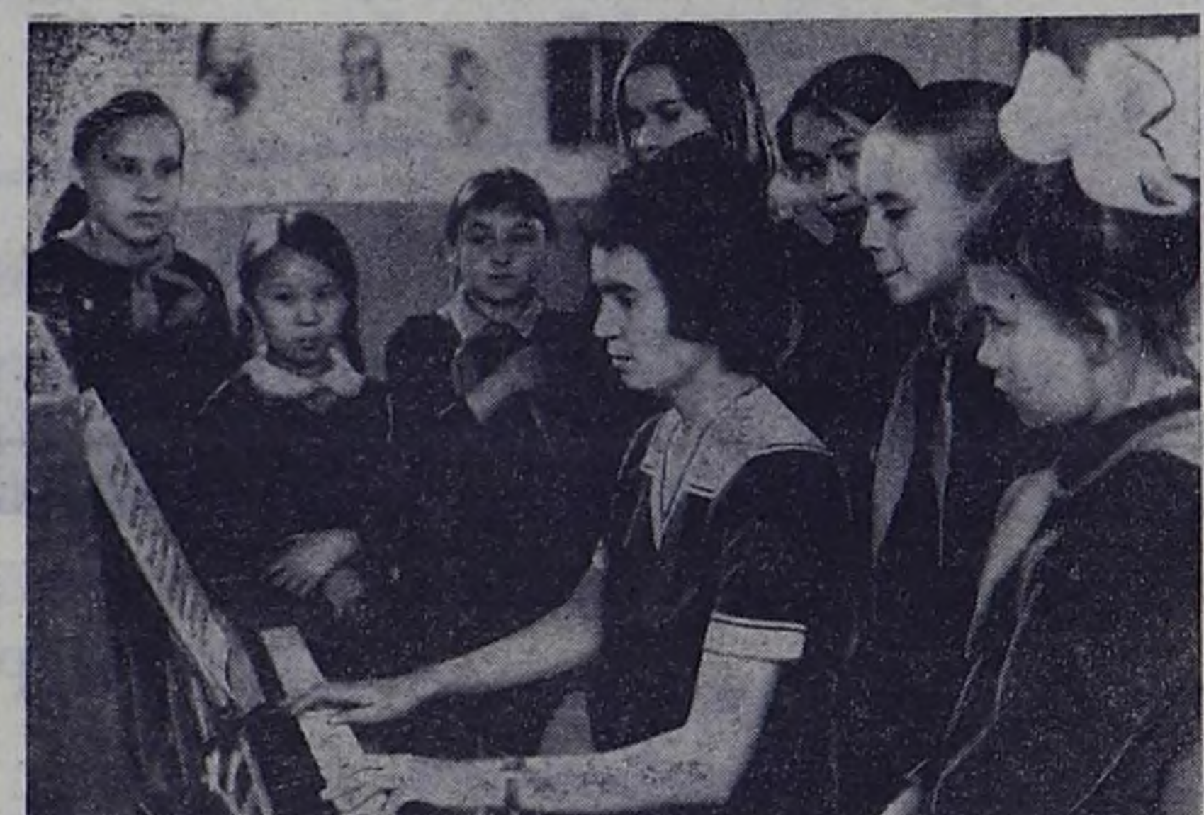
К миру искусства, к музыкальной культуре, созданной разными народами на протяжении веков, приближаются дети рабочих и служащих, туvinцы и русские, в шестидесяти детских музыкальных школах нашей республики.

ВЛАДИВОСТОК, 12 сентября. (Корр. ТАСС). Баскетболисты «Динамо» из Новосибирска подтвердили свое право выступать в высшей лиге, выйдя по