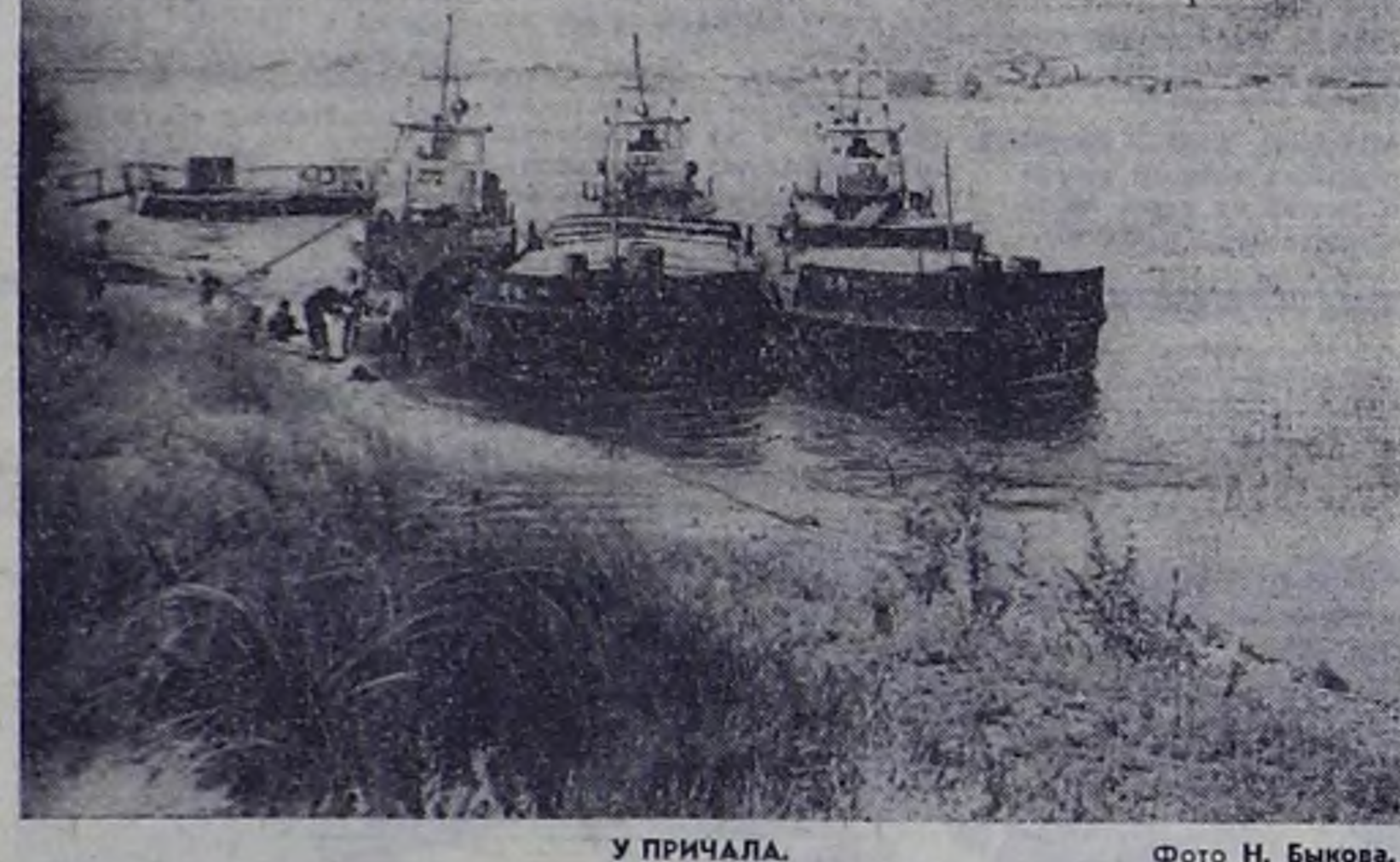
У ПРИЧАЛА.