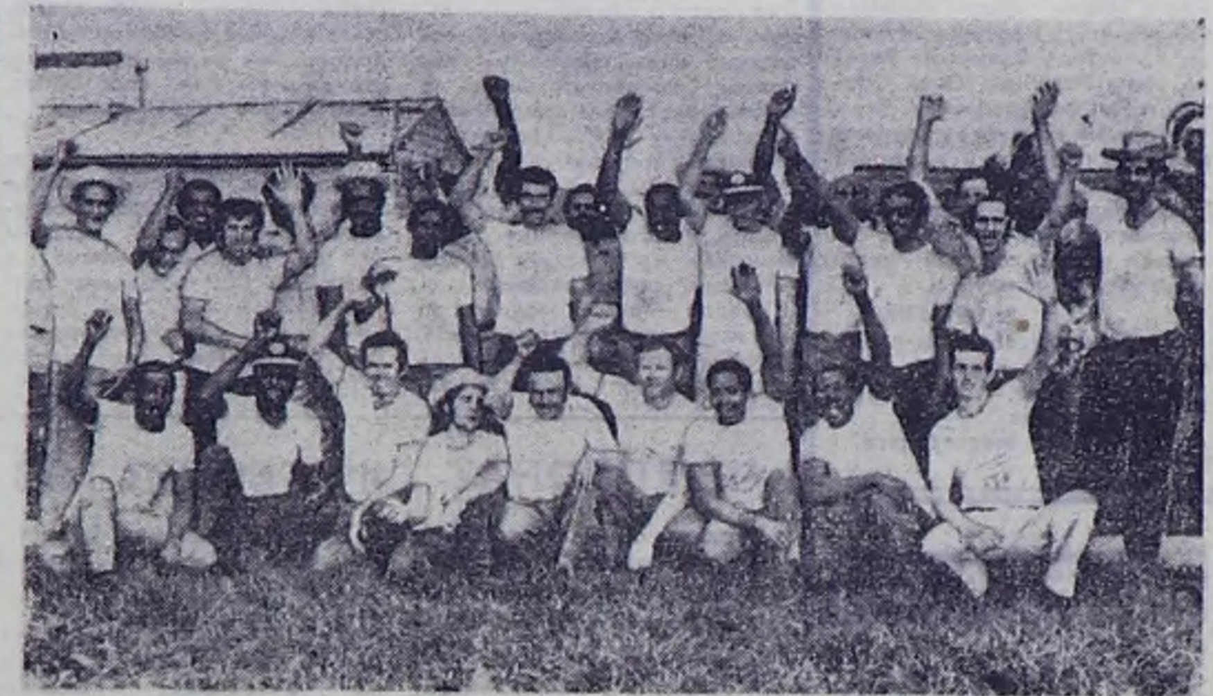
На Кубе завершился очередной сезон уборки и переработки сахарного тростника. Позади остались месяцы упорного труда огромной коллективы: механизаторов, рабочих сахарных заводов. По многим показателям результаты нынешней сафры значительно превосходят прошлые. В частности, увеличилось число бригад механизаторов и звеньев механизаторов, убравших по миллиону и более арб тростника (одна арба равна 11,5 кг).

УДАПЕШТ, 4 июля. (ТАСС). Газета «Неспасибаш» опубликовала текст интервью первого секретаря ЦК ВКРП Яноша Кадара, которое он дал западной газете «Франкфуртер рундschau». Основными в отношении между ФРГ и Кадар подчеркнул, что сотрудничество между двумя странами может быть хорошим примером мирного сосуществования стран с различным общественным строем.