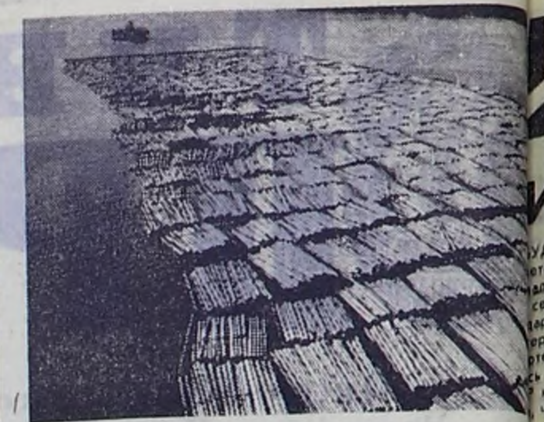
На таежных реках Коми края в разгаре сплавная навигация буксирных судов Северного речного пароходства. На снимке: большегрузный плот на Вычегде.