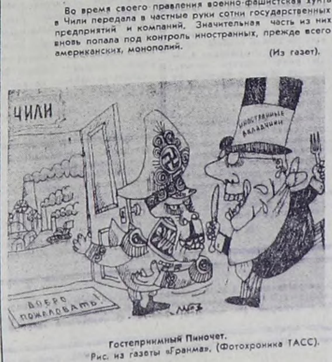
Гостеприимный Пиночет. Рис. из газеты «Гранма». (Фотохроника ТАСС).

Париж. Равная оплата за равный труд — это давнее требование французских женщин до сих пор не удовлетворено. По данным французского демократического печатного профсоюза, женщины получают зарплату ниже официального уровня. Среднегодовая зарплата женщин на треть меньше заработка мужчин. Усиливая предпринимателей, как отмечалось на состоявшемся собрании женщин Парижского района, в стране как бы созданы два рынка труда: один — для мужчин, другой — для женщин. Для второй категории — менее рабочих мест, менее квалифицированной работы, меньшей зарплата за равный труд. Женщины составляют во Франции 39 процентов национальной рабочей силы и одновременно — более половины армии безработных. Вашингтон. Несмотря на то, что американский конгресс еще в 1972 году рекомендовал принять поправку к конституции США, провозглашающую равенство женщин с мужчинами, эта поправка до сих пор не получила законодательной силы. Для принятия поправки требуется ратификация ее законодательными собраниями двух третей американских штатов. Однако на сегодняшний день поправка одобрена лишь 35 штатами. Если к марту 1979 года она не будет принята, то мечта американских женщин о равноправии, хотя бы формально запрещенная в конституции, так и останется неосуществленной. Как и в других капиталистических странах, американские женщины подвергаются в США огромной эксплуатации в области оплаты труда и оплаты за работу. Зарплата американки составляет лишь 59 процентов того, что получает за работу мужчина.