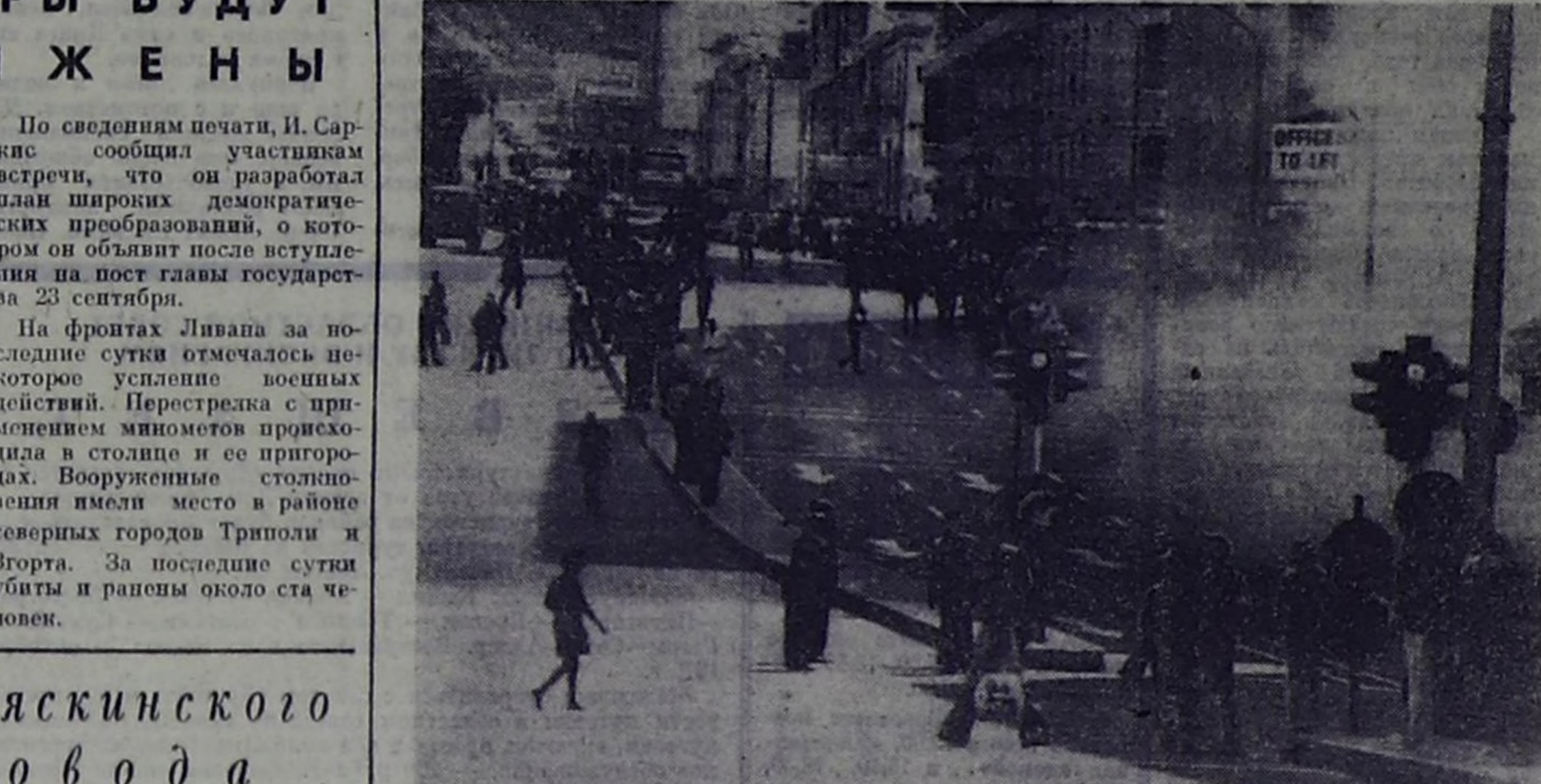
Ю А. Р. Несмотря на жестокие полицейские репрессии в Кейптауне не затихают антирасистские выступления «белогого» населения этого крупнейшего южноафриканского порта.