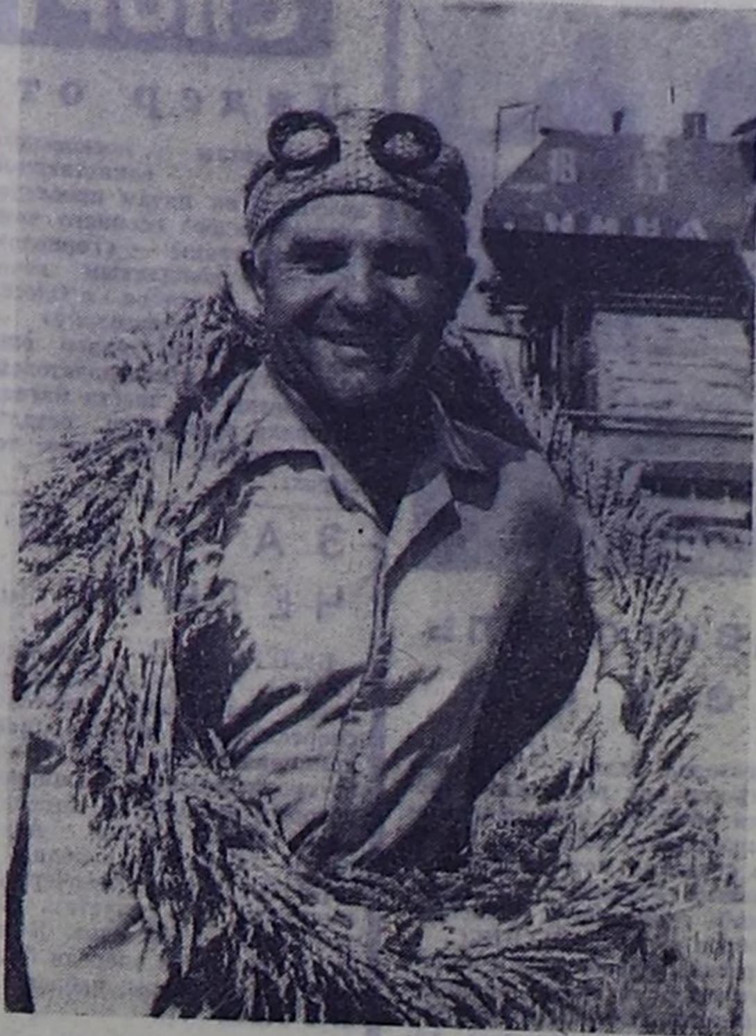
Оренбургская область. Хлеборобы совхоза имени Ленина Белевского района выработали хороший урожай зерновых. По примеру кубанцев они перемогли свои обязательства. Государство получит 330 тысяч центнеров зерна, на 80 тысяч больше ранее принятых обязательств.

В зависимости от вида растения, степени его измельчения, условий уборки и хранения соломы к кормлению различны. Цель и приемы приготовления соломы к кормлению различны. Цель и приемы приготовления соломы к кормлению различны.