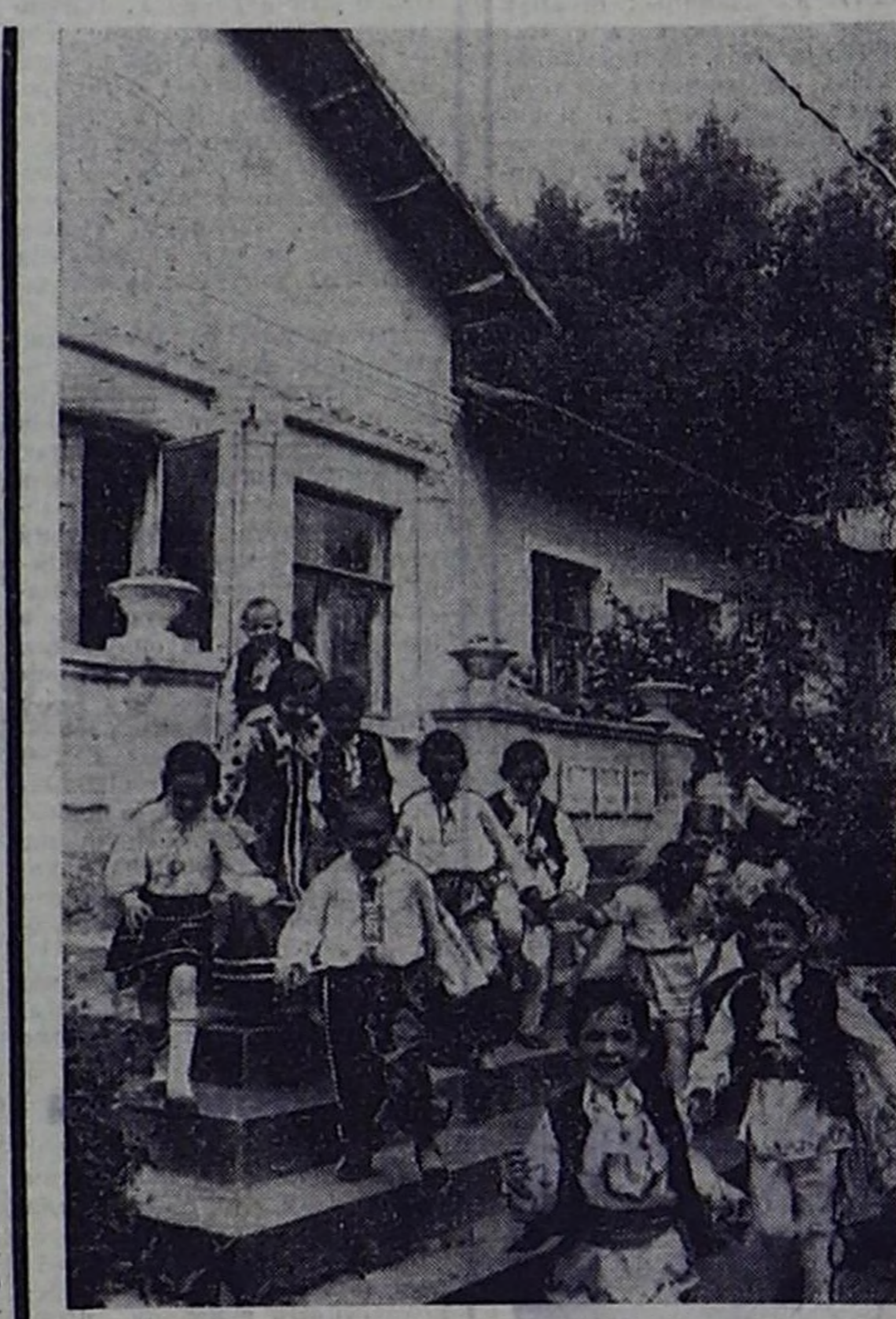
В детском саду совхоза-завода «Романовы» Молдавии.

Дом семьи Сухорословых просторный, красивый снаружи, внутри производит впечатление некоего заброшенного.