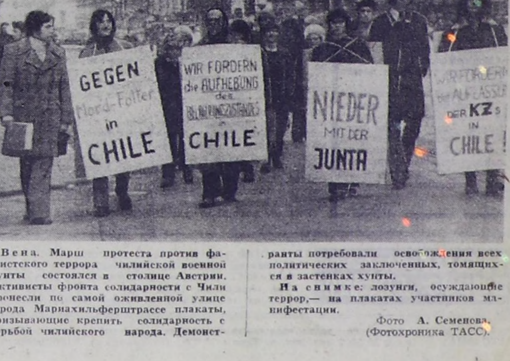
Вена. Марш протеста против фа-шистского террора чилийской военной хунты состоялся в столице Австрии. Активисты фронта солидарности с Чили пронесли по самой оживленной улице города Мариахильферштрассе плакаты, призывающие крепить солидарность с борьбой чилийского народа. Демон-странты потребовали освобождения всех политических заключенных, томившихся в застенках хунты. На снимке: лозунги, осуждающие террор, — на плакатах участников мани-фестации.