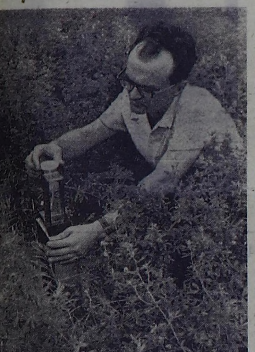
Оригинальный прибор для определения сроков полива сельскохозяйственных культур создан в Институте гидрологии и мелиорации в Туркменской ССР. Внешне это небольшой сосуд с напесенной на него шкалой, показывающей степень влажности. Он имеет подвижный «грибок», днашка которого служит индикатором, а «корень» опущен в почву. Прибор сигнализирует о необходимости полива, издавая звуковой сигнал.

БЕРЛИН, 15 июля. (ТАСС). Центральные газеты опубликовали призывы к 25-й годовщине ГДР. Образованное первое социалистическое государство на германской земле рассматривается в нем как поворотный пункт в истории немецкого народа и Европы. Это стало возможным в результате победы советского народа и его славной армии над гитлеровскими фашистами.