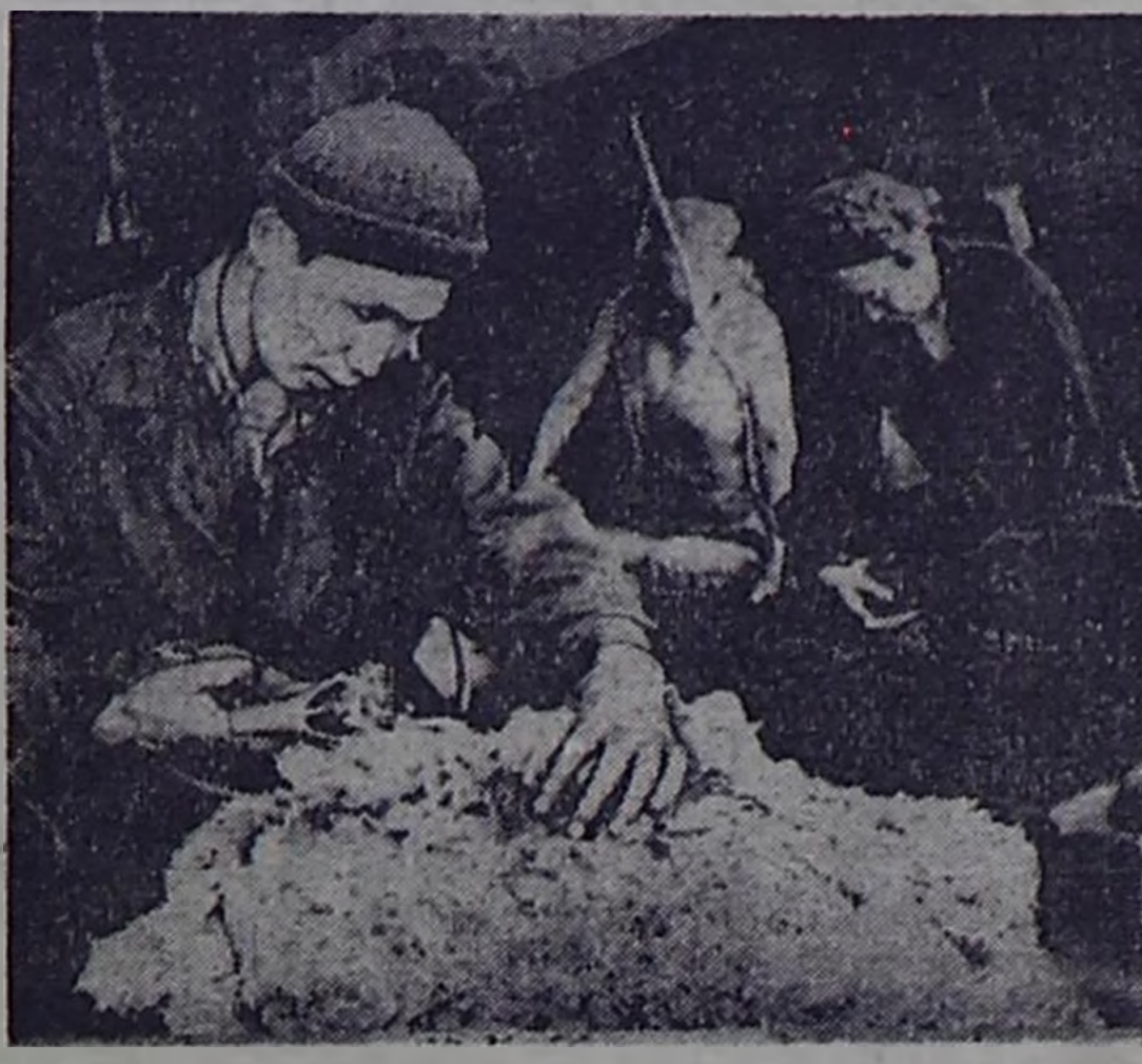
На сто пятьдесят процентов выполнены полугодные задания по сбору государству овцеводческих овцеводов.

Узница рабочих кадров. В комбинате остро ощущается нехватка рабочих кадров. Многие специалисты уходят в другие предприятия, а новые кадры не успевают вырабатываться. Руководство комбината принимает меры для привлечения молодежи и повышения квалификации рабочих. Вводится система наставничества, проводятся курсы повышения квалификации.