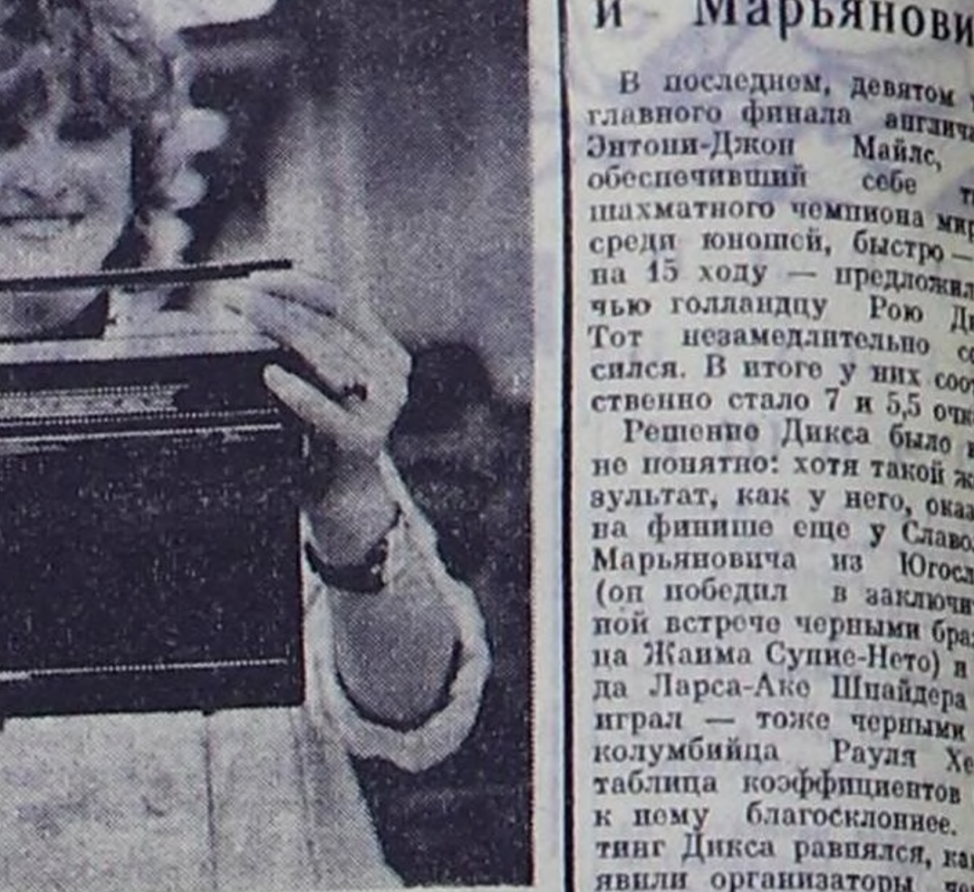
Рижский завод «ВЭФ» приступил к производству нового транзисторного радиоприемника «Спидола-208». По сравнению со своим предшественником он значительно мощнее и чувствительнее, отличается высокочастотной акустикой, современным внешним видом. По своим техническим и эксплуатационным данным «Спидола-208» не уступает лучшим зарубежным аппаратам и превосходит многие из них.