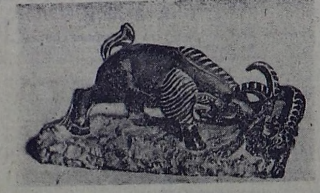
«Схватка с волком» (серпентинит).