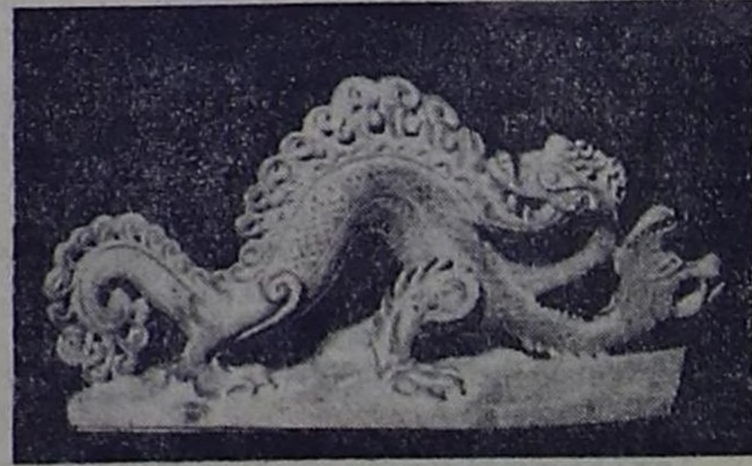
«Змей Горыныч» (агальматолит).