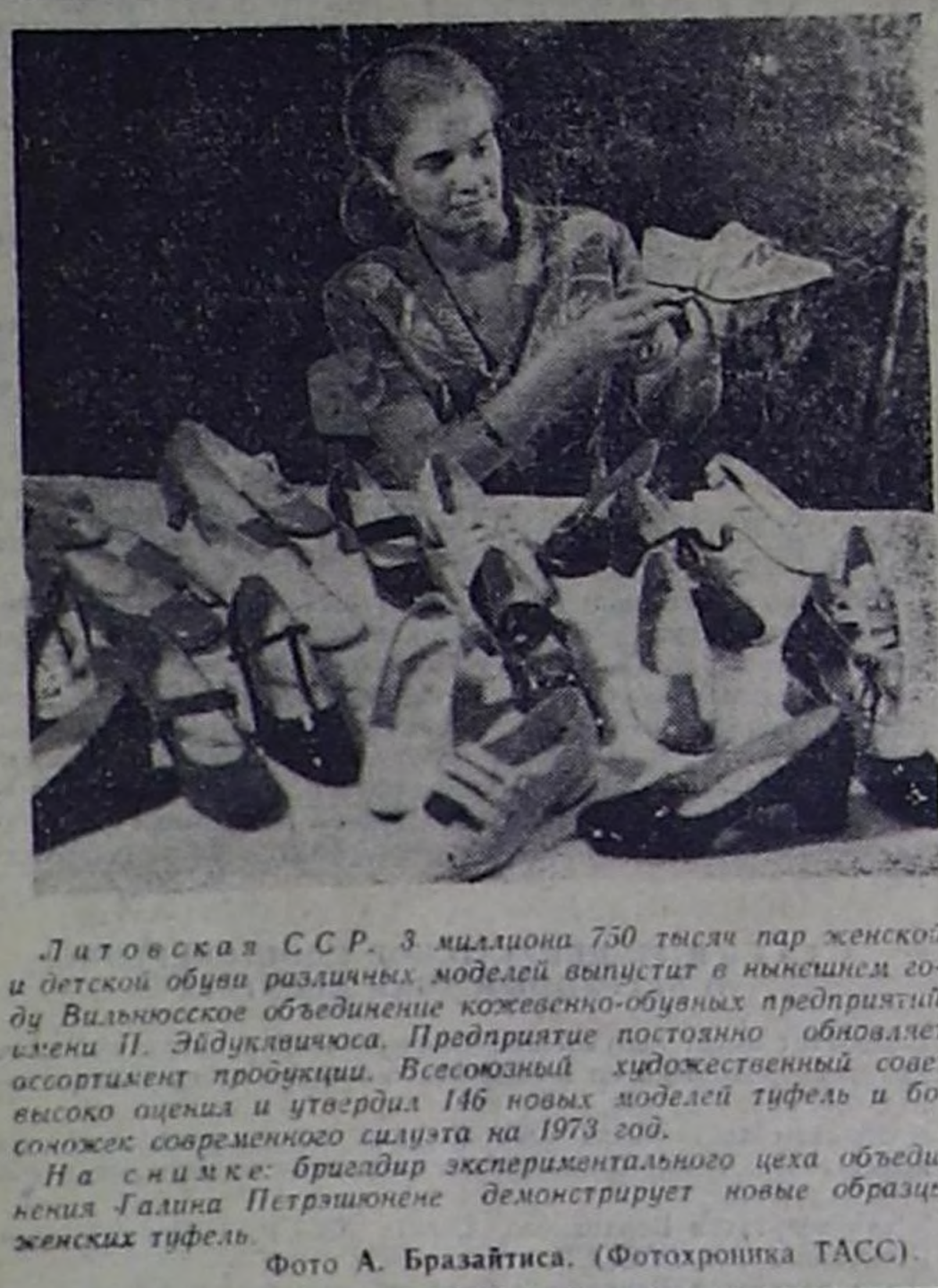
Литовская ССР. 3 миллиона 750 тысяч пар женской и детской обуви различных моделей выпущена в нынешнем году Виленского объединения кожевенно-обувных предприятий имени П. Эдугайниса. Предприятие постоянно обновляет ассортимент продукции. Всеобщий художественный совет высоко оценил и утвердил 146 новых моделей туфель и ботинок современного силуэта на 1973 год.