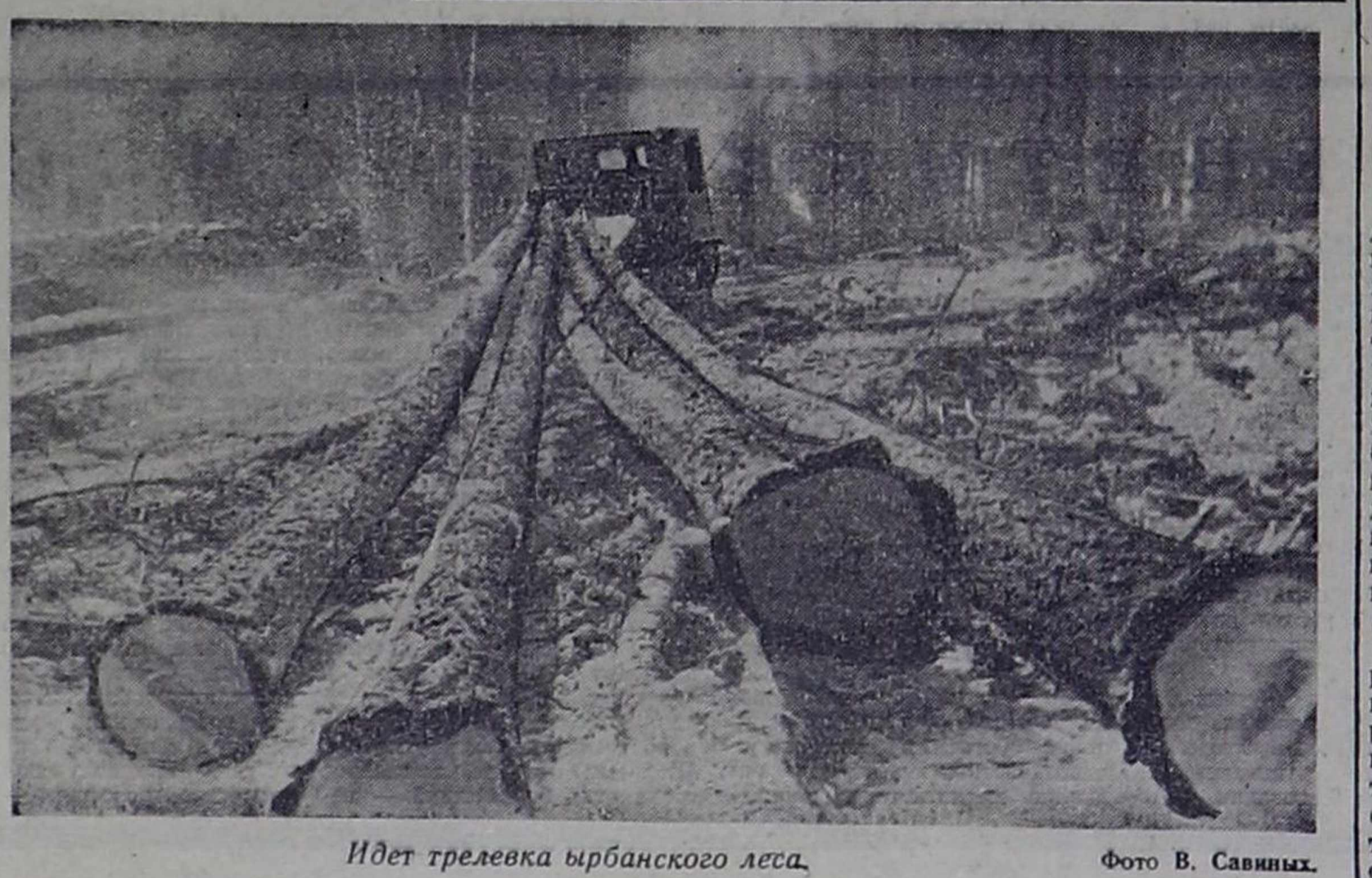
Идет трелевка Ырбанского леса.

«СССР на пути строительства коммунизма (1959—1970 гг.)». Книга написана коллективом авторов. Она открывается главами, в которых рассказывается об общественно-политической жизни страны в этот период, ее экономическом развитии. На большом фактическом материале показана возрастная роль Коммунистической партии во всех сферах материальной и духовной жизни нашего общества. Заключительная глава посвящена XXIV съезду КПСС. Выводы съезда, его оценки положены в основу книги. Издание рассчитано на пропагандистов, лекторов, преподавателей, всех, интересующихся историей советского общества. «Созвучье полвека». Автор книги — доктор исторических наук В. М. Шапоко рассказывает об образовании и развитии Союза Советских Социалистических Республик, о том, как после Великой Октябрьской социалистической революции в нашей стране под руководством ленинской Коммунистической партии был разрешен национальный вопрос, созданы условия для подлинного равенства народов, их свободного развития в едином многонациональном социалистическом государстве. «Товарищ Олекса». В этой небольшой книжке, вышедшей в серии «Герои Советской Родины», украинский писатель Анатолий Стась рассказывает об Алексее Алексеевиче Боркняке — Герое Советского Союза. Плавный борец за освобождение своего края, секретарь Закарпатского крайкома партии А. А. Боркняк, товарищ Олекса, как звали его друзья коммунисты, погиб в фашистском застенке в 1942 году. (Корр. ТАСС).