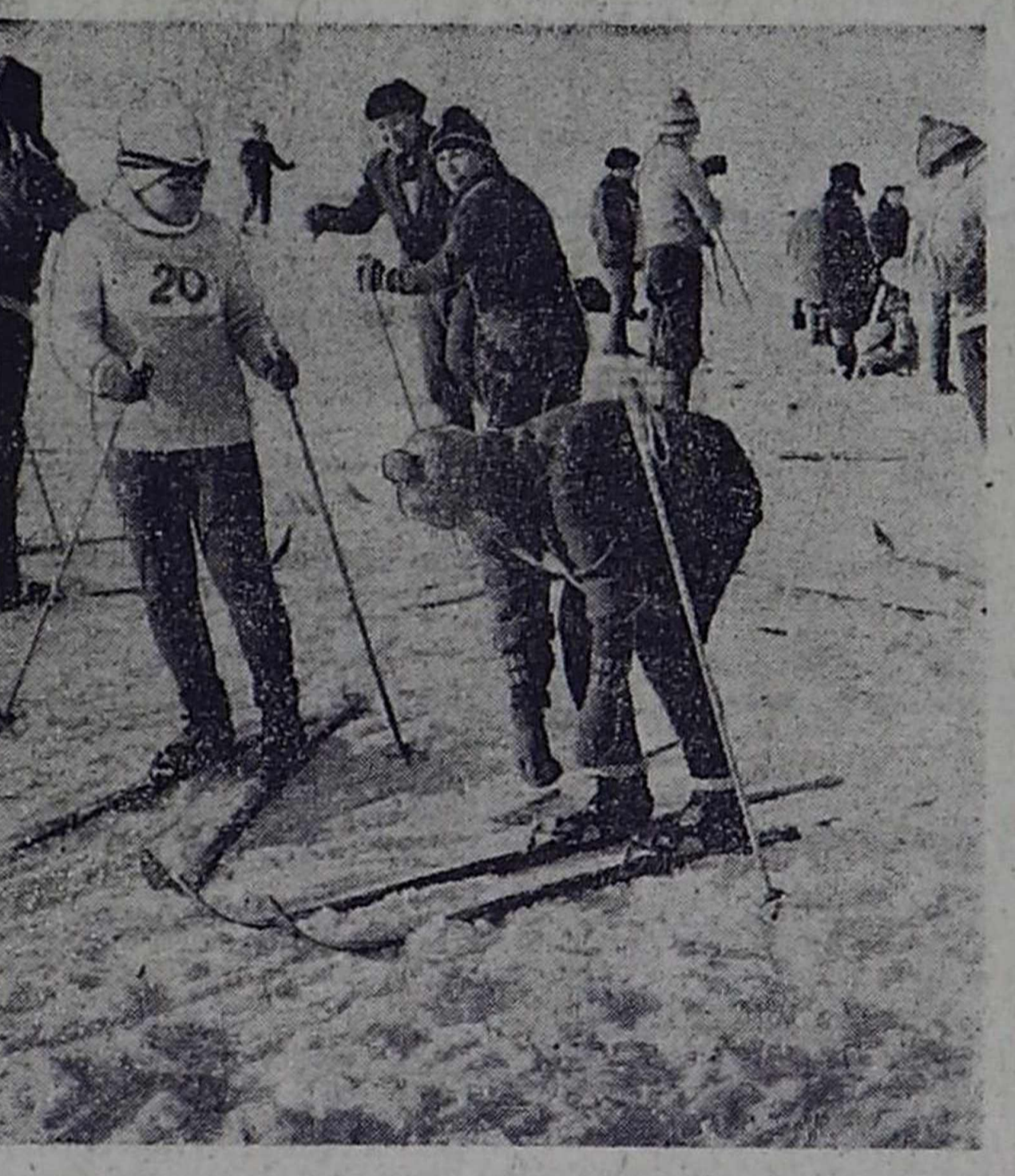
Погода была самая «кошачья»: яркое солнце, безветрие, минус шесть. Но лед Макараи оставляет загадкой для скороходов. То он

Редакция газеты «Тувинская правда» СНИМАЕТ КВАРТИРЫ для сотрудников. Обращаться в редакцию газеты, телефон 26-80.