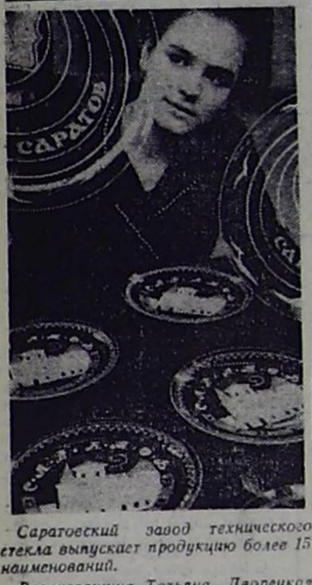
Саратовский завод технического стекла выпускает продукцию более 15 наименований.

Даугавпилс, Латвийская ССР. (Корр. ТАСС).