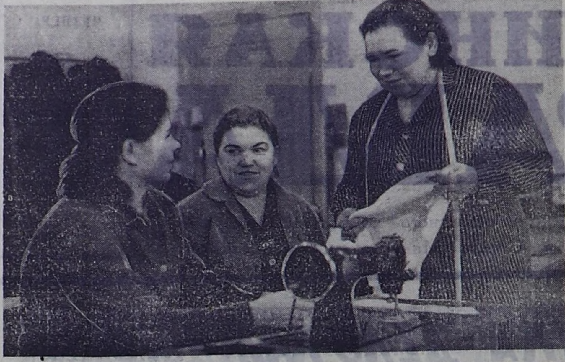
Коллектив швейного цеха в Бай-Хаакском комбинате бытового обслуживания постоянно добивается высоких трудовых показателей.