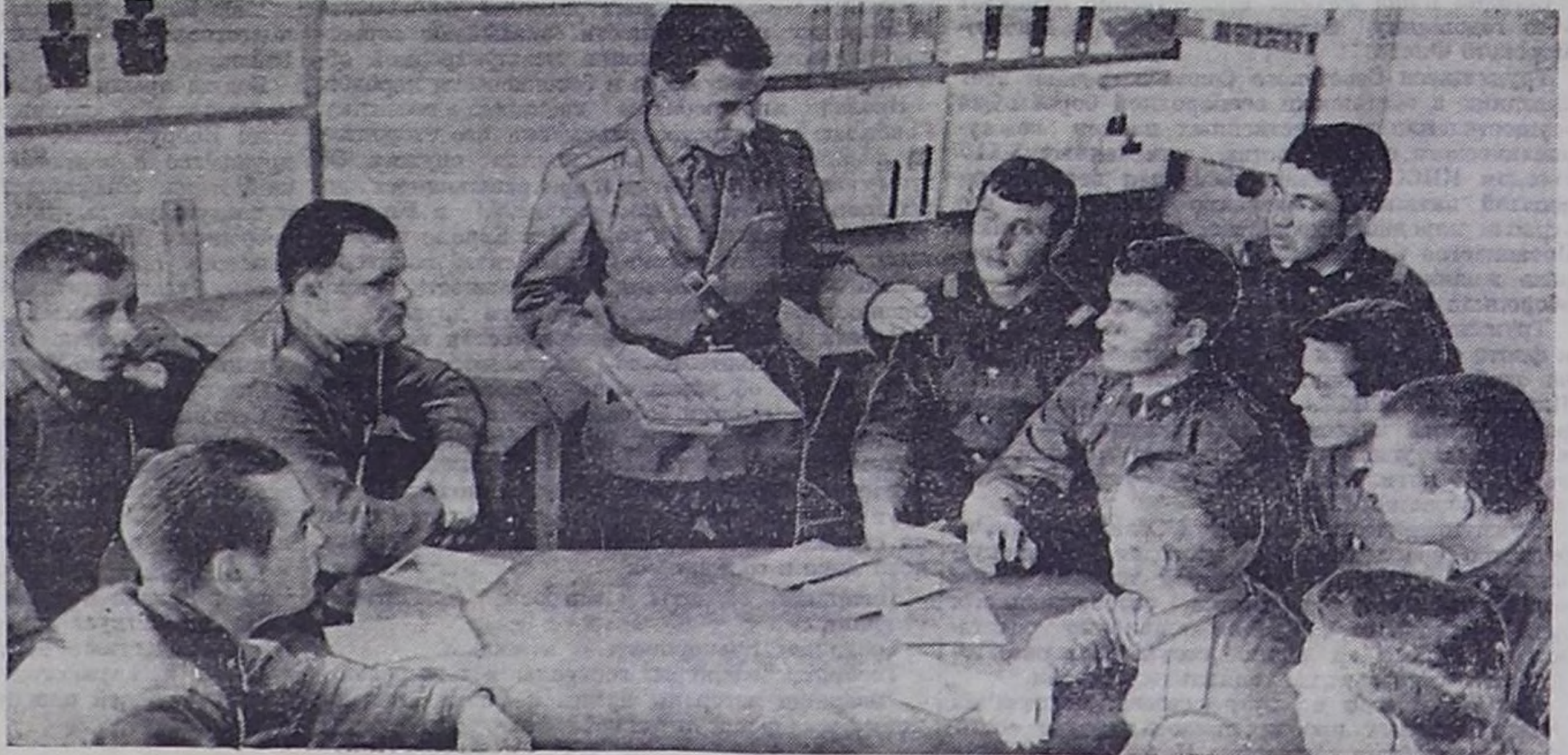
На снимке: сегодня — очередное Ленинское чтение...

С. НАЗАРОВ, капитан в отставке, г. Кызыл.