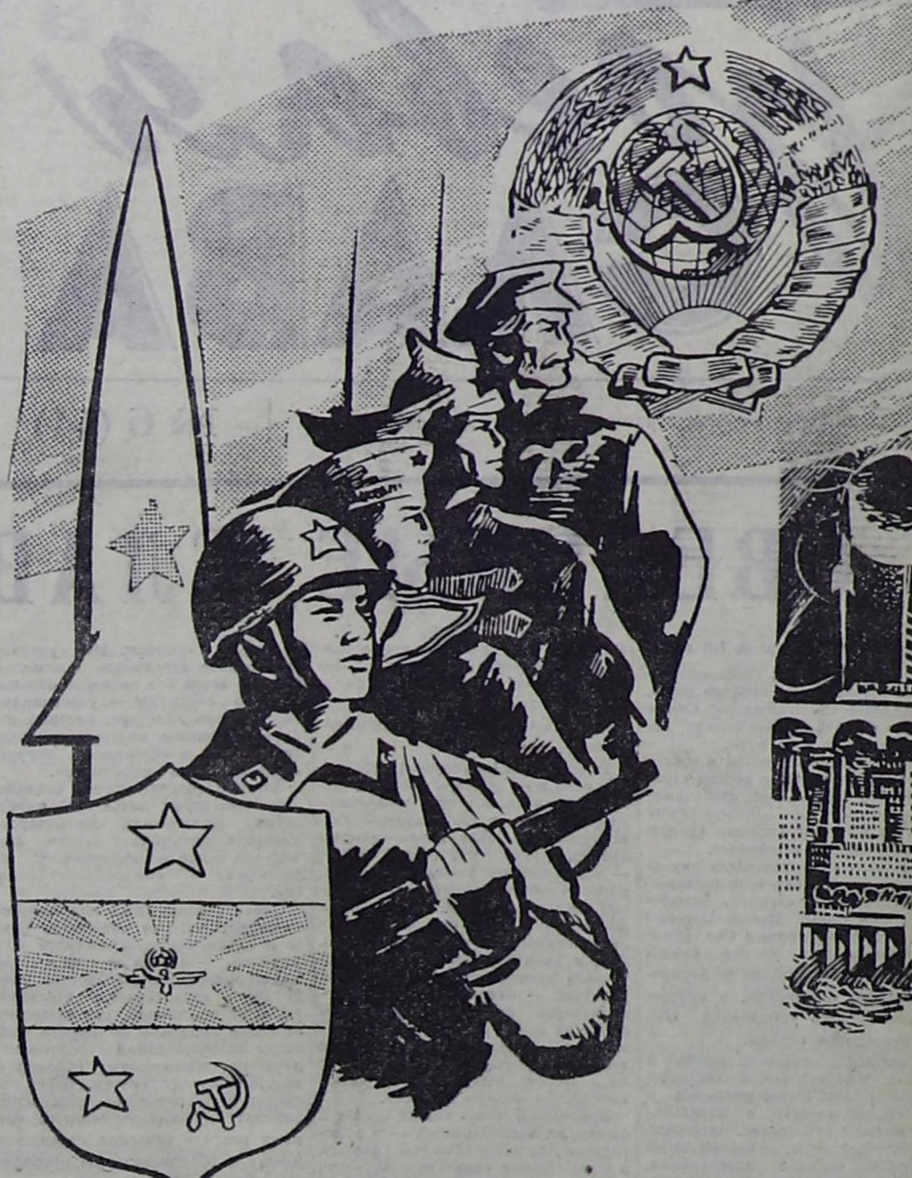
Рис. В. Волченко.

Товарищи воины Советских Вооруженных Сил! Товарищи ветераны армии и флота, находящиеся в запасе и отставке! Сегодня наша Родина торжественно отмечает 54-ю годовщину Советской Армии и Военно-Морского Флота. Трудящиеся Советского Союза встречают этот праздник в обстановке всенародной борьбы за осуществление величественных планов коммунистического строительства, намеченных XXIV съездом КПСС. Успешно завершив первый год десятилетия. Уверенно развиваются все отрасли народного хозяйства, наука и техника. Повышается благосостояние и культурный уровень жизни народа. Растет экономическая и оборонная мощь Советского государства. Труженики города и деревни, воины армии и флота с огромным воодушевлением единодушно одобрили решения ноябрьского (1971 года) Пленума ЦК КПСС. В стране с новой силой развернулось массовое социалистическое соревнование за успешное выполнение заданий второго года пятилетия, достойную встречу 50-летия образования СССР. Коммунистическая партия и Советское правительство последовательно проводят ленинскую внешнюю политику, в которой твердый отпор империализму и поддержка революционного, освободительного движения неизменно сочетаются с курсом на мирное осуществление государства с различным социальным строем. Важным шагом на пути решения внешних международных проблем явилось недавно состоявшееся в Праге совещание Политического консультативного комитета государств — участни-