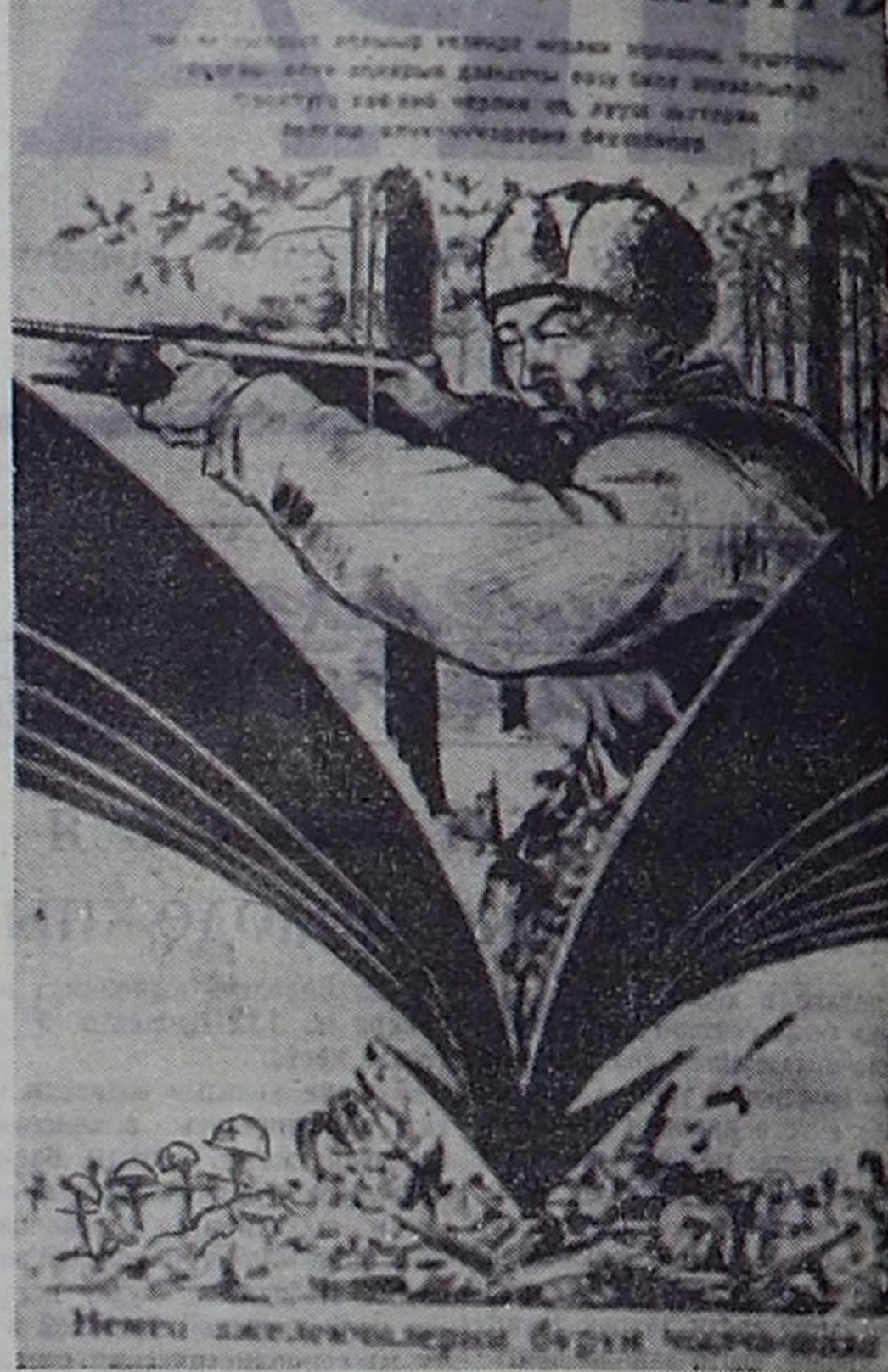
Плакат художника В. Ф. Демина времён Великой Отечественной войны.