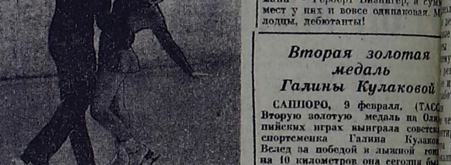
На сцене: (справа) чемпион мира и Европы Ирина Роднина и Алексей Уланов — обладатели золотых медалей XI Олимпийских игр; (слева) «серебряный» пара Людмила Смирнова и Андрей Сурайкин.