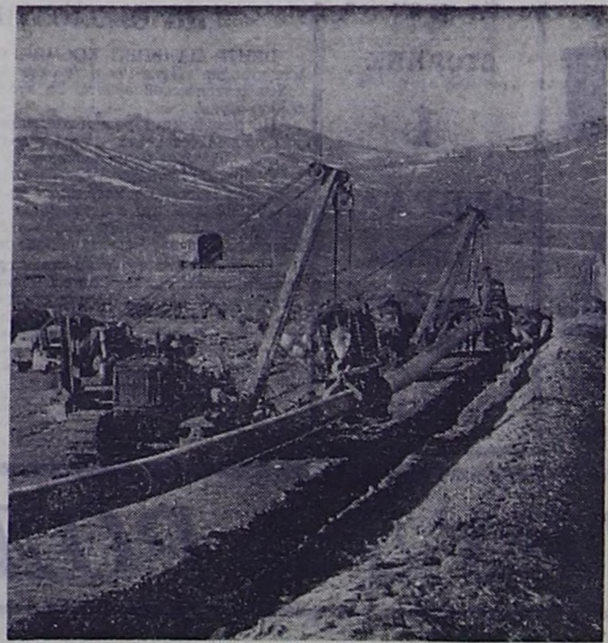
Дагестанская АССР. В предгорьях Дагестана в урочище Шамхал-Булак геологи обнаружили крупнейшее в республике месторождение голубого газа. В сутки здесь можно получить до миллиона кубометров газа. Для использования нового месторождения быстрыми темпами сооружается магистральный трубопровод Шамхал-Булак—Махачкала. Работы выполняет строительное управление № 1 производственного объединения «Севкалгазстрой».

На снимке: на строительстве газопровода Шамхал-Булак—Махачкала.