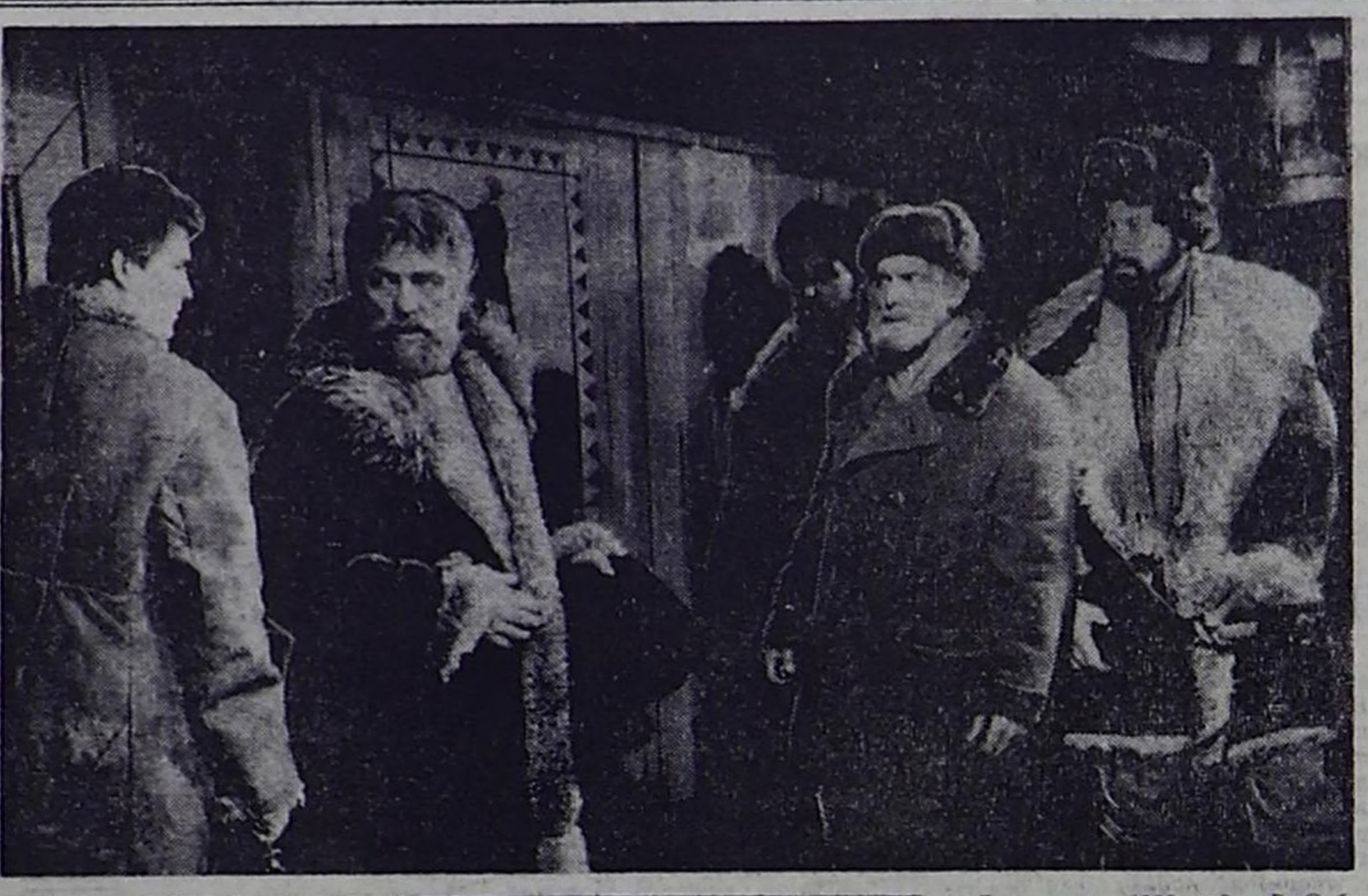
...Была зима 1922 года. В Сибири Советская власть только устанавливалась. Постепенно налаживалась жизнь. Но в отдаленных тяжелых деревнях было неспокойно — по тайге бродили банды, состоящие из остатков козачьей армии и местных кулаков. При налетах на деревни они убивали активистов, грабили сельсоветы, избивали детей... О том, как в одной из таких банд в деревне Байкаль боролся последний губернский ПТУ старший чекист коммунист Василий Платонович Родионов и его помощник комсомолец Кузьма, а также о том, как банды, возглавляемые кулаком Любимым, была с помощью местной бедноты разгромлена, рассказывает цветной широкоформатный фильм «Конец Любимых».