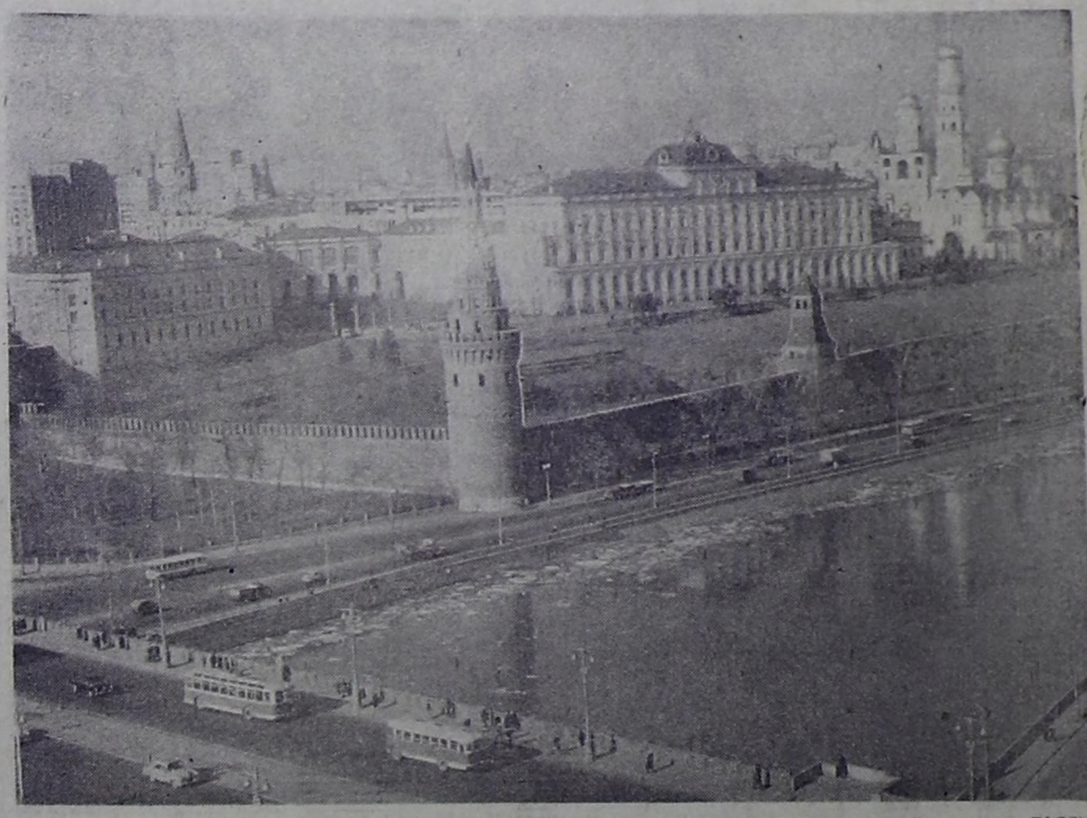
МОСКВА, КРЕМЛЬ.

ЦК КПСС, Совет Министров СССР, ВЦСПС и ЦК ВЛКСМ выражают твердую уверенность в том, что колхозники, рабочие совхозов, механизаторы, специалисты, молодежь села — все работники сельского хозяйства активно включатся во всенародное социалистическое соревнование и добьются в 1973 году значительных успехов в повышении урожаев, увеличении валовых сборов зерно- и всех других культур, обеспечении животноводства кормами, в выполнении народнохозяйственных планов и социалистических обязательств по продаже сельскохозяйственных продуктов государству.