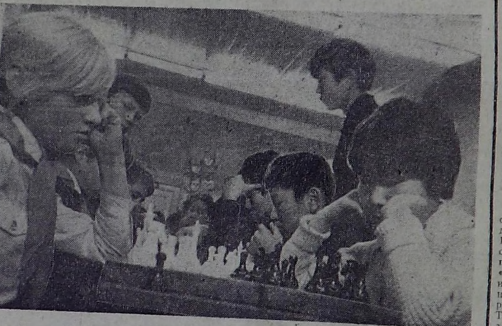
На снимке: участники матча «Белая ладья».