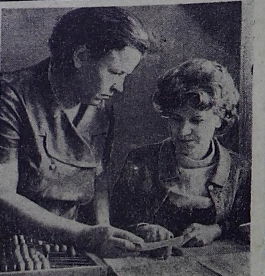
Опытными работниками считаются в центральной сберегательной трудовой кассе Кызыла старший кассир...