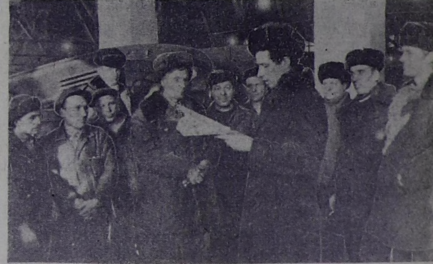
В коллективе Кызылского АТП-1 с большим интересом знакомятся с материалами совместного торжественного заседания ЦК КПСС, Верховного Совета СССР и Верховного Совета РСФСР, посвященного 50-летию образования СССР. Политинформаторы проводят коллективные чтения доклада Генерального секретаря ЦК КПСС тов. Л. И. Брежнева.