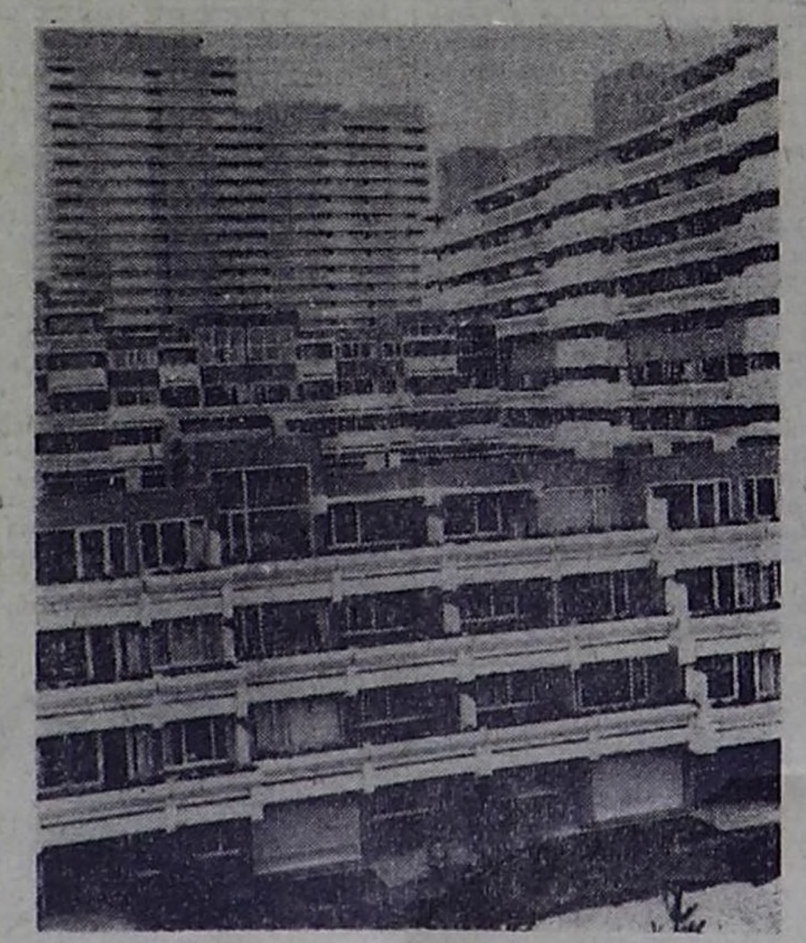
25 августа 1972 года в Мюнхене начнутся XX летние Олимпийские игры. На снимке: олимпийская деревня.

Республиканская типография РЕАЛИЗУЕТ все виды бланков бухгалтерского учета.