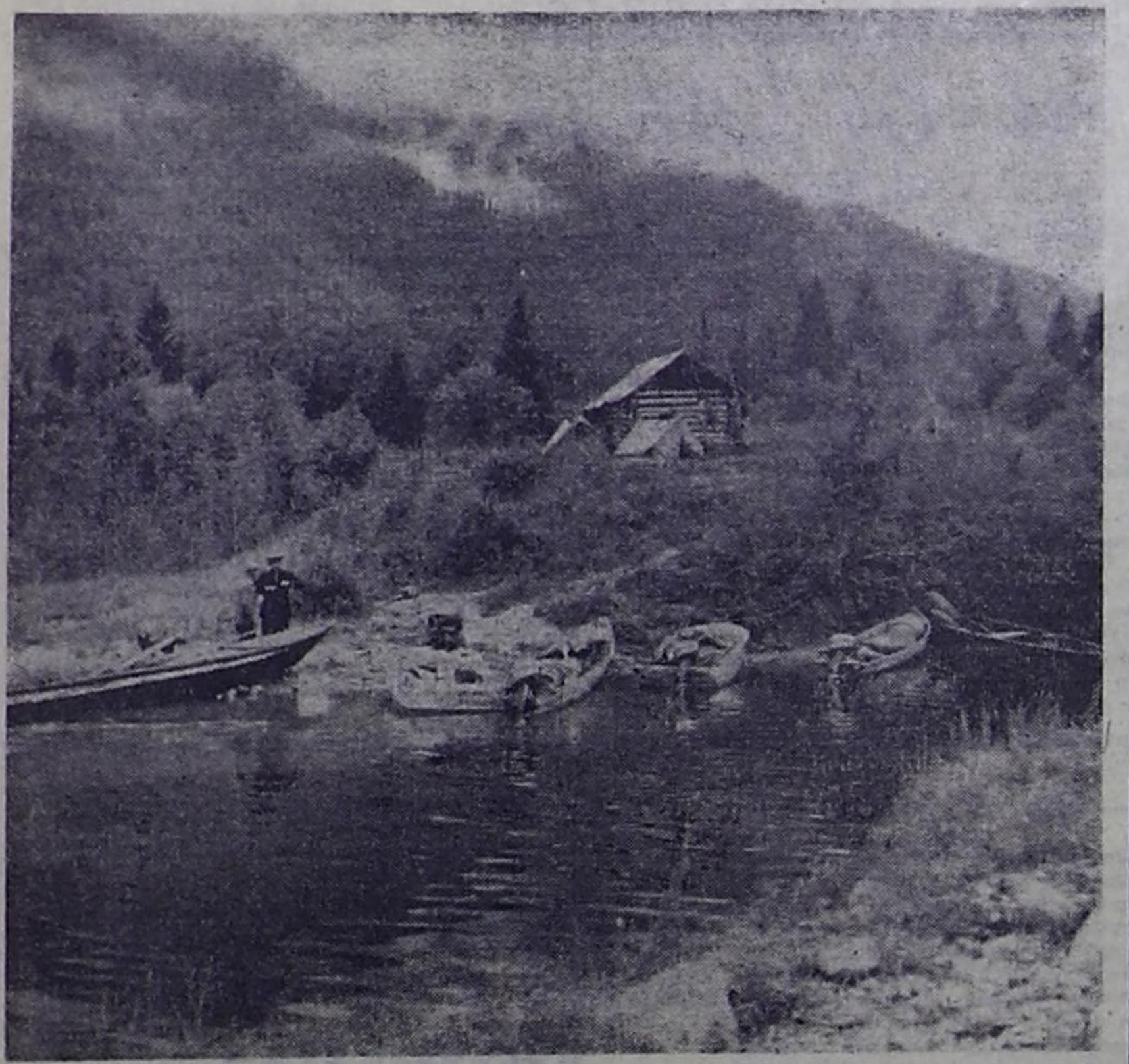
Утро в Саянах.

2. Я уже в первый год участвую в крупных соревнованиях, и, естественно, среди спортсменов, с кем я участвую на Олимпиаде в Мюнхене, у меня много знакомых и друзей. В том виде конного спорта, где я выступаю, — выездке — нет разделения по мужские и женские составы, и тем не менее у нас есть свой женский класс. Я с