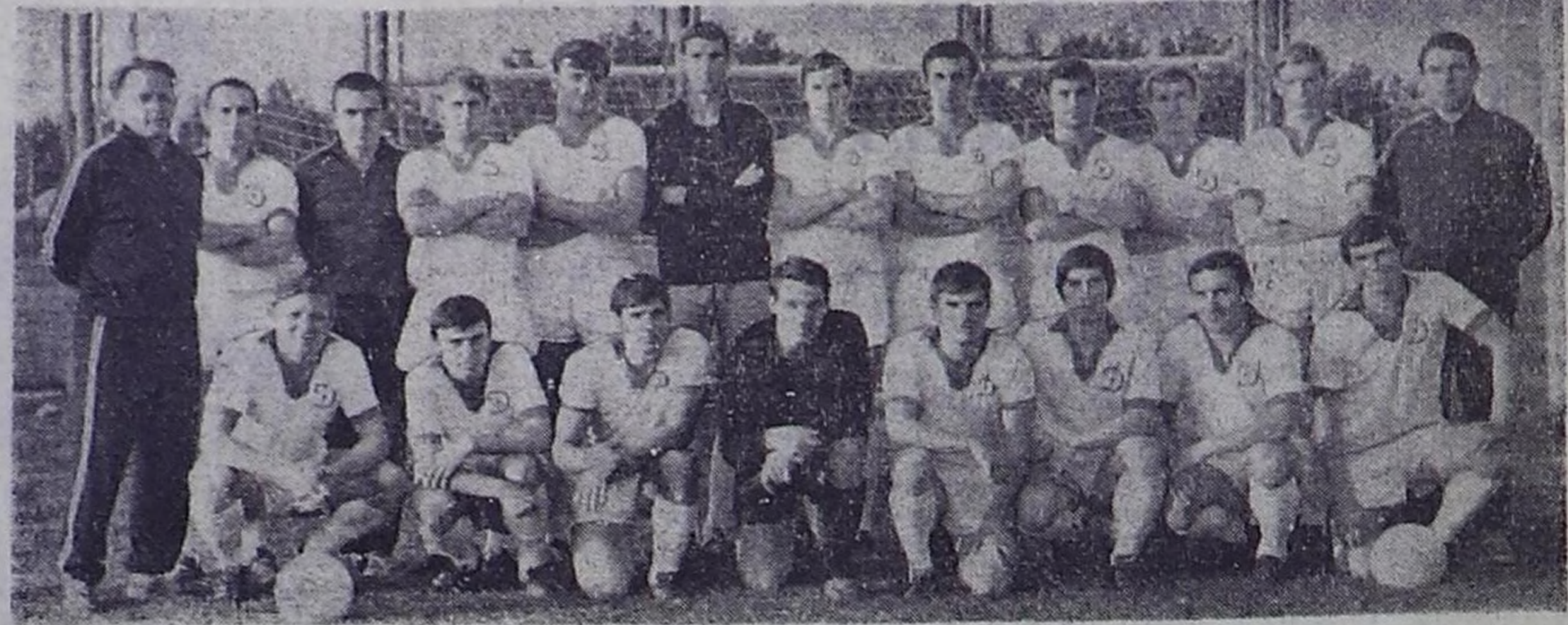
Футболисты киевского «Динамо» за три тура до финиша завоевали в пятый раз звание чемпионов СССР.