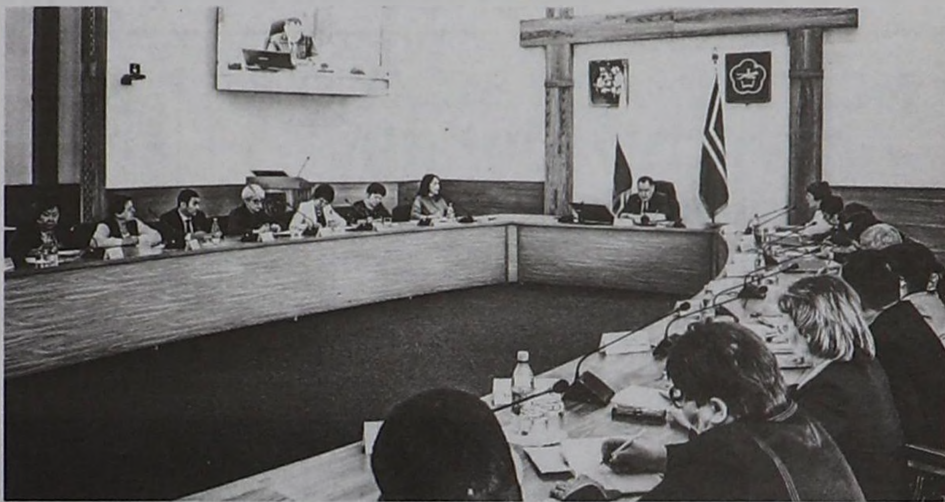
(Төнчүзү. Эгези 1-ги арында).

Бо чылдың-даа, оон мурнунда-даа чылдарның доозукчулары Чаңгыс аай күрүне шылгалдаларында хөй кезинде гуманитарлыг угланышкынын эртемнерни шилип ап турарының дугайында медээлерни сайгарган. Ол эки бе азы багай бе? Ниитизи-биле-даа, аңгылап-даа көөр болза – ол багай. Республикада инженер угланышкынын тускай эртемниг кижилер чедишпейн турар, а гуманитарлыг эртемнер доозуп алган кижилер ажыл чоктар одуруун чылдан чылче чүс-чүзү-биле долдуруп турар. Социал адырларга ол өлүг дипломнар аар чүк болуп дүжүп, республика чыдып каап турар регионнарның санындан уштунмастан. Өөреникчилерниң келир үеде мергежилин шилип алырынче угланган ажилдар багай чоруттунуп турар дээрзин шупту билер. Ол ыш-каш школалар, ортумак болгаш дээди өөредилге черлери бот-боттарынга ажыктыг кады ажилдажылганы чорудуп болур дээрзин база шупту билип турар бис. Ынчалза-даа көскү