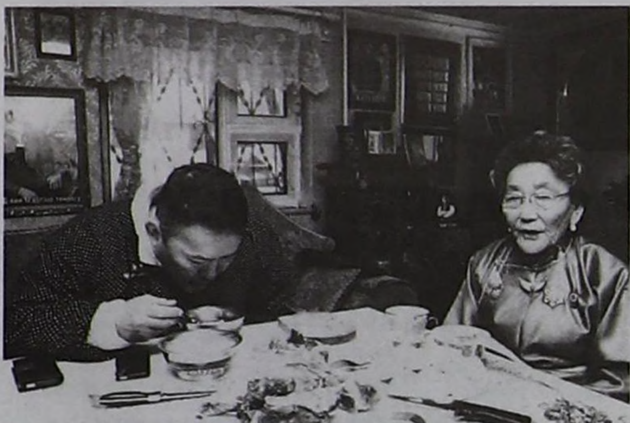
Моолдун президентизи Х. Баттулга аязы-биле.

Моолдун президентизи Халтмаагийн Баттулгунун төрүттүнген хүнүн таварыштыр сеткилимниң ханызындан байыр чедирип, быжыг кадыкшылды база чонунун мурнунга улуг-улуг чедиш-киннерни күзедим!" – деп, Тываның Баштыңы Шолбан Кара-оол бодунун социал четкилеринде арнында бижээн.