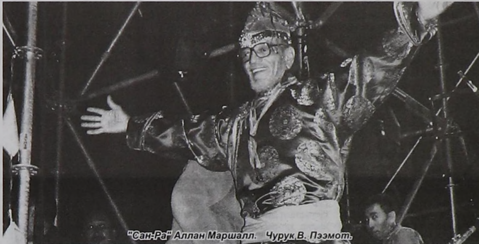
«Сан-Ра» Аллан Маршалл.

шажын чүдүлгөвис дузалаар деп бодааш, фестиваль эгелээрин сүмележиپ эгеледивис.