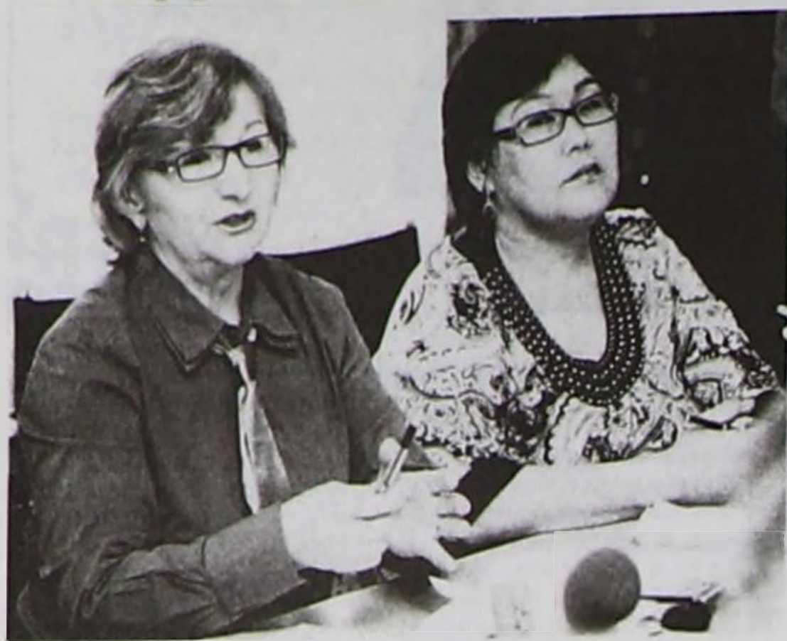
(Төнчүзү. Эгези 1-ги арында).

Республикада уксаалыг малдарны азырап, сайырадып турган ажил-агыйларның саны эрткен чылын эвээжээн турган. Ооң чылдагааны — Эйлиг-Хемде ошкү