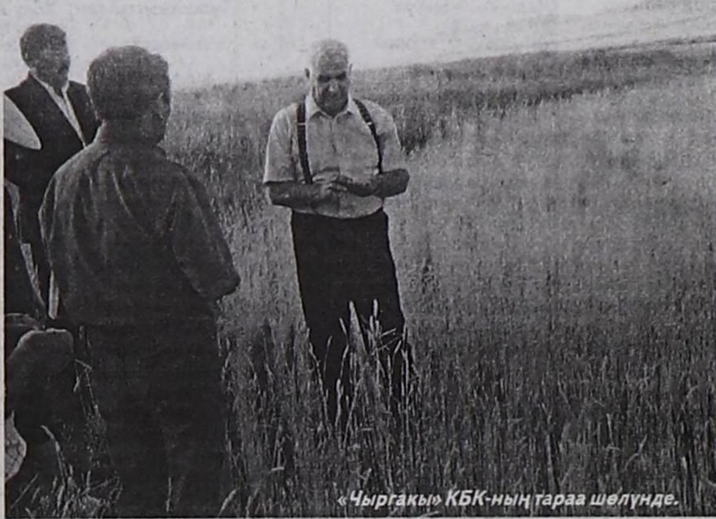
«Чыргакы» КБК-ның тараа шөлүндө.