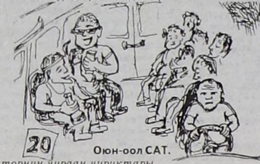
20 Оюн-оол САТ. Авторнуң чураан чуруктары.