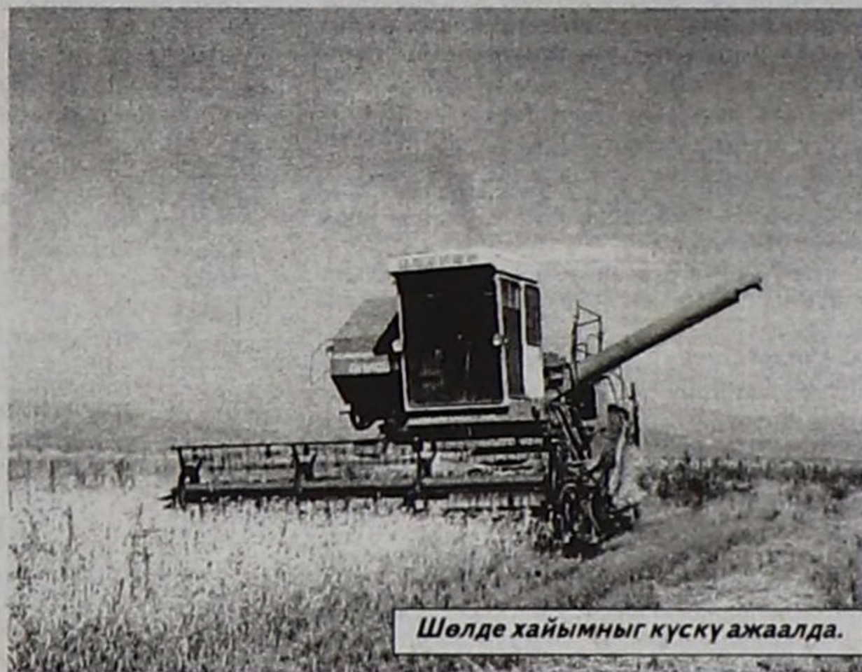
Шөлде хайымныг күску ажаалда.