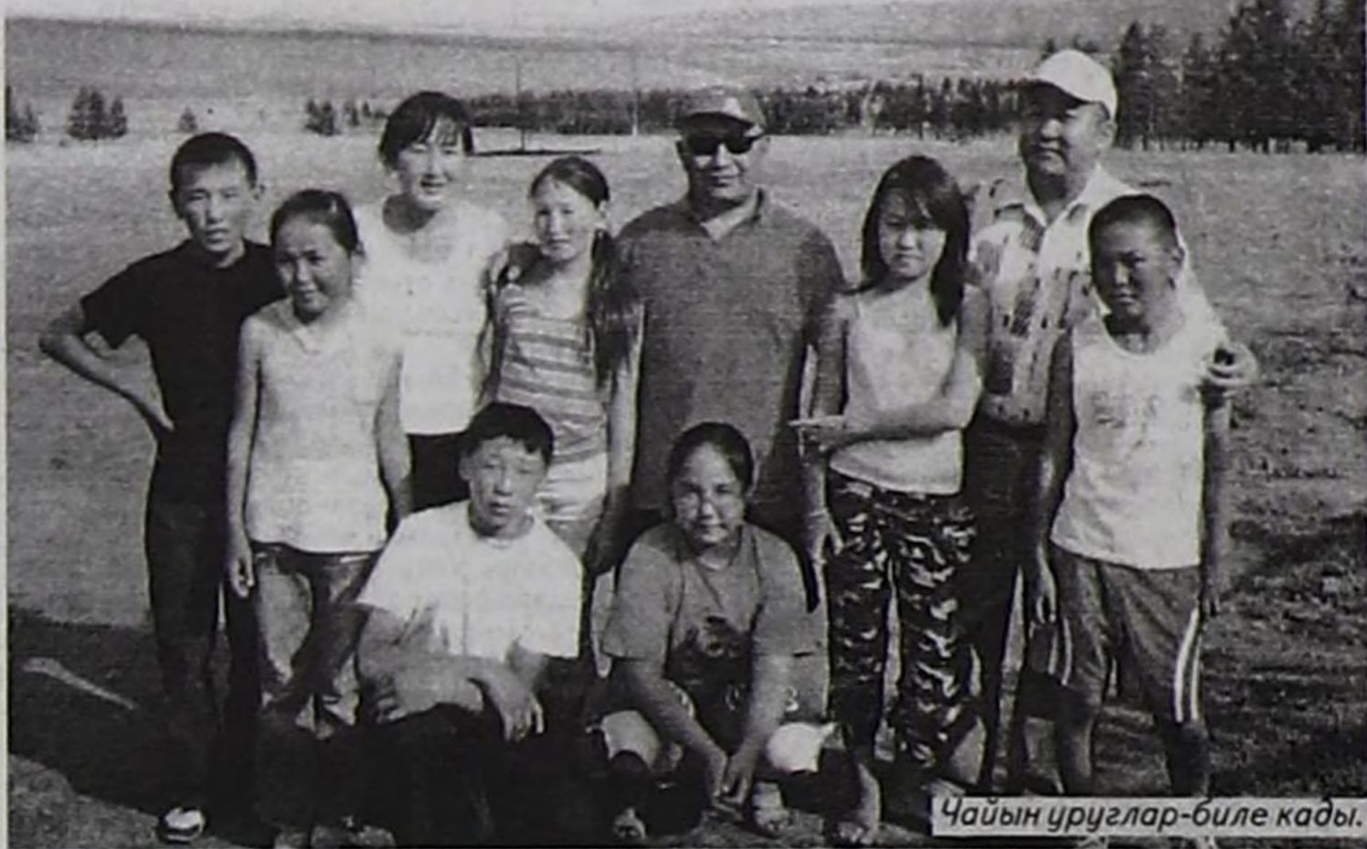
Чайын уруглар-биле кады.