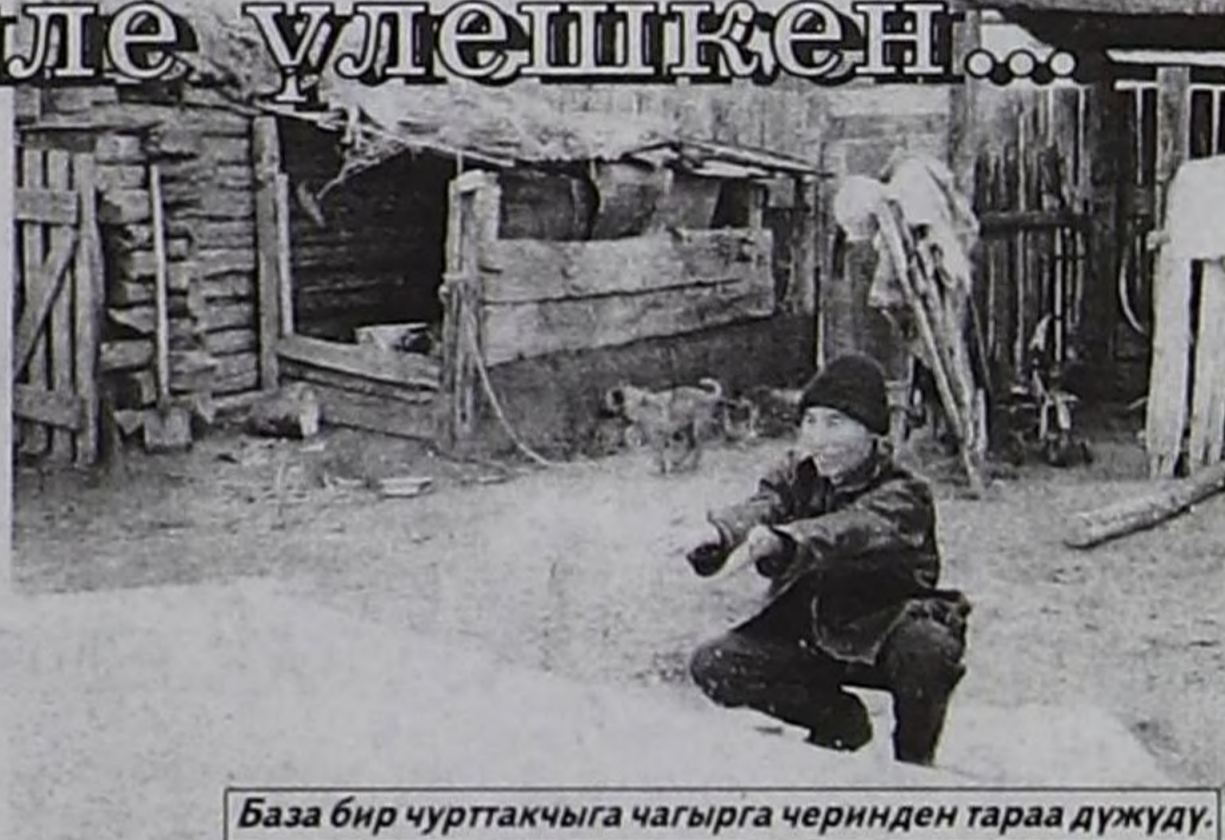
База бир чурттакчыга чагырга черинден тараа дүжүдү.

ны сезен тос кижичүрүзү. Ынчалза-даа амыдыралының деңгели чүгээр улуска тараа-биле дузалабайн турар бис.