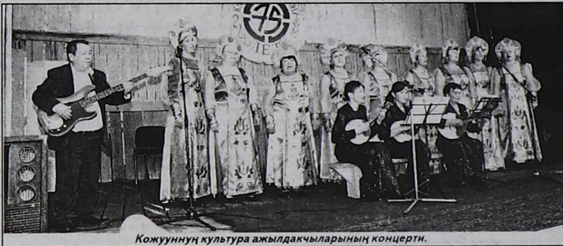
Кожуунун культура ажилдакчыларының концерти.