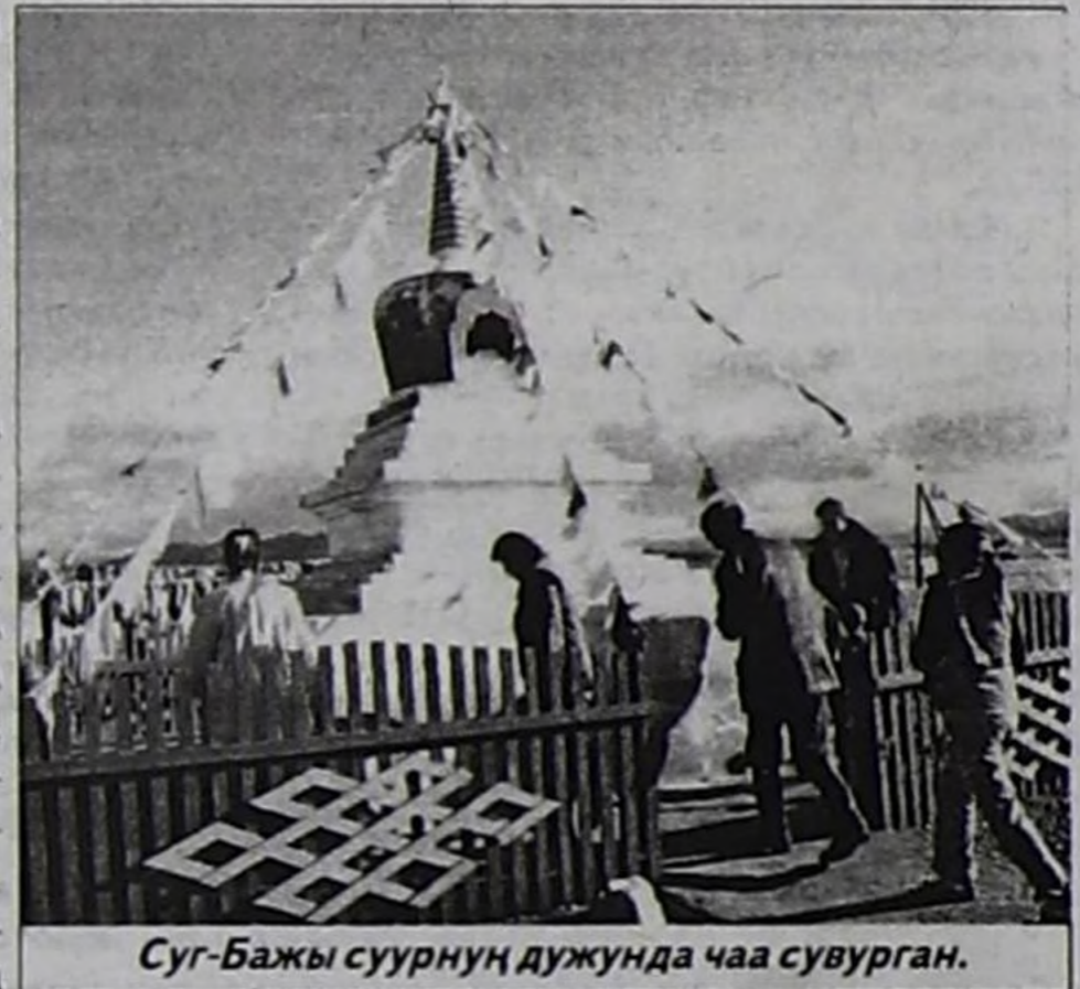
Суг-Бажы суурнуң дужунда чаа суурган.

Сөстү Улуг Хуралдың Төлээлекчилер палатазының даргазының оралакчызы Н.С.Германова алгаш, байыр чедиришкенин номчааш, Улуг Хуралдың Хүндүлел бижиктери-биле адырлар аайы-биле ажил-агыйга чедишкенин болган дыка хөй каа-хемчилерни шаңнааш, белектерни тывыскаан. Улаштыр Улуг Хуралдың Хоойлу-