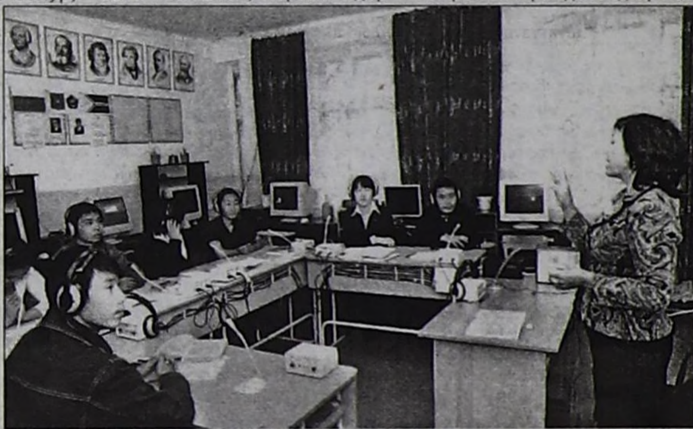
Республиканың дыңнавар уруглар школазында ээлчеглиг кичээл.

Даргавыс орта черле ажилдавас, харын-даа кеземче херээнге каразыттырып турар, ыңчангаш бүзүрөвөс бис деп кудумчуга таварышканымы дыңнавар улус чугаалады. Ындыг болза солуур үе келген эвес чүве бе?! Кым ажилдап болурул? Маңаа өскениң салымчолу дээш кайнаар-даа болза кылаштап, дүлей улус-биле эгин кожа өөренип өскөн, байдалды эки билир кижии херек деп бодаар мен.