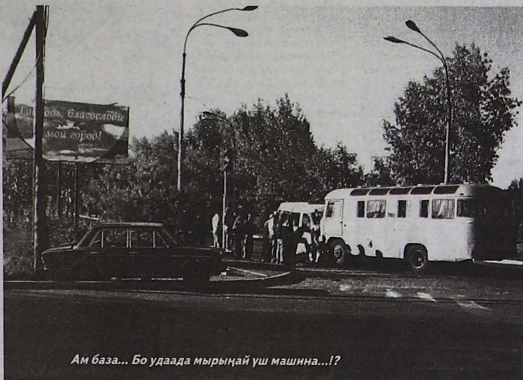
Ам база... Бо удаада мырыңай үш машина...!?