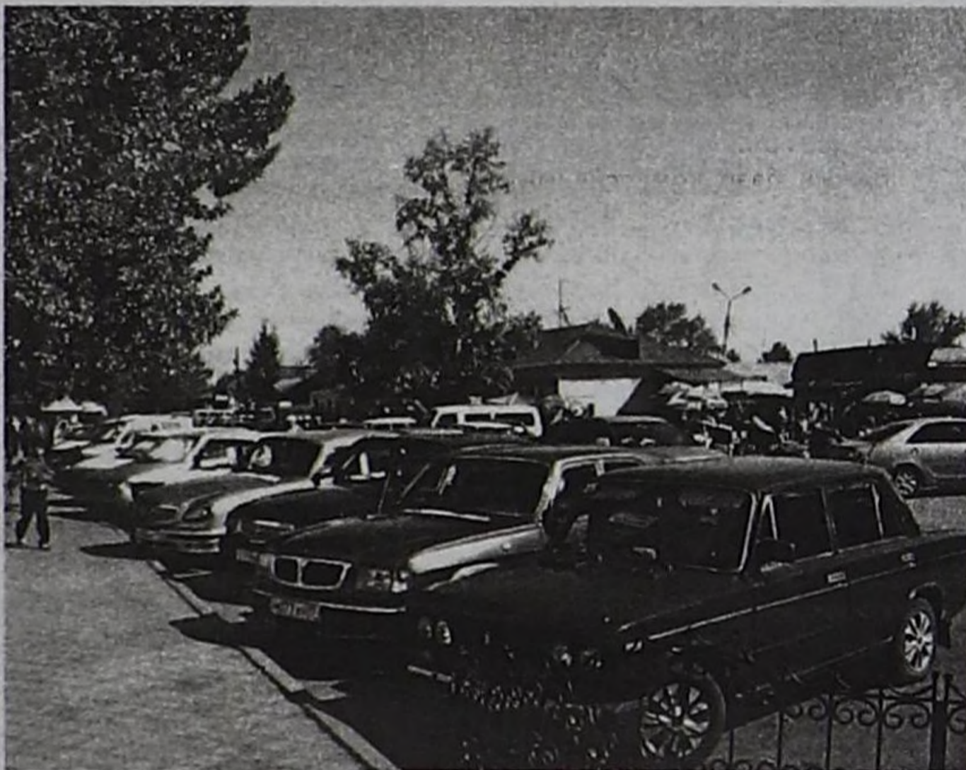
«Гаруда» садыг төвүнүн мурнуу талазында орук кезээде мындыг муңгаш турар. Кайыын, кайнаар эртерил?

ОШАЧКИ-ниң чамдык ажылдакчыларының санап турары-биле алырга, бо чылдың август 1-ден эгелеп орук шимчээшкенин чамдык дүрүмнерин шыңгыраткаш, оларны херек кырында ажыглап