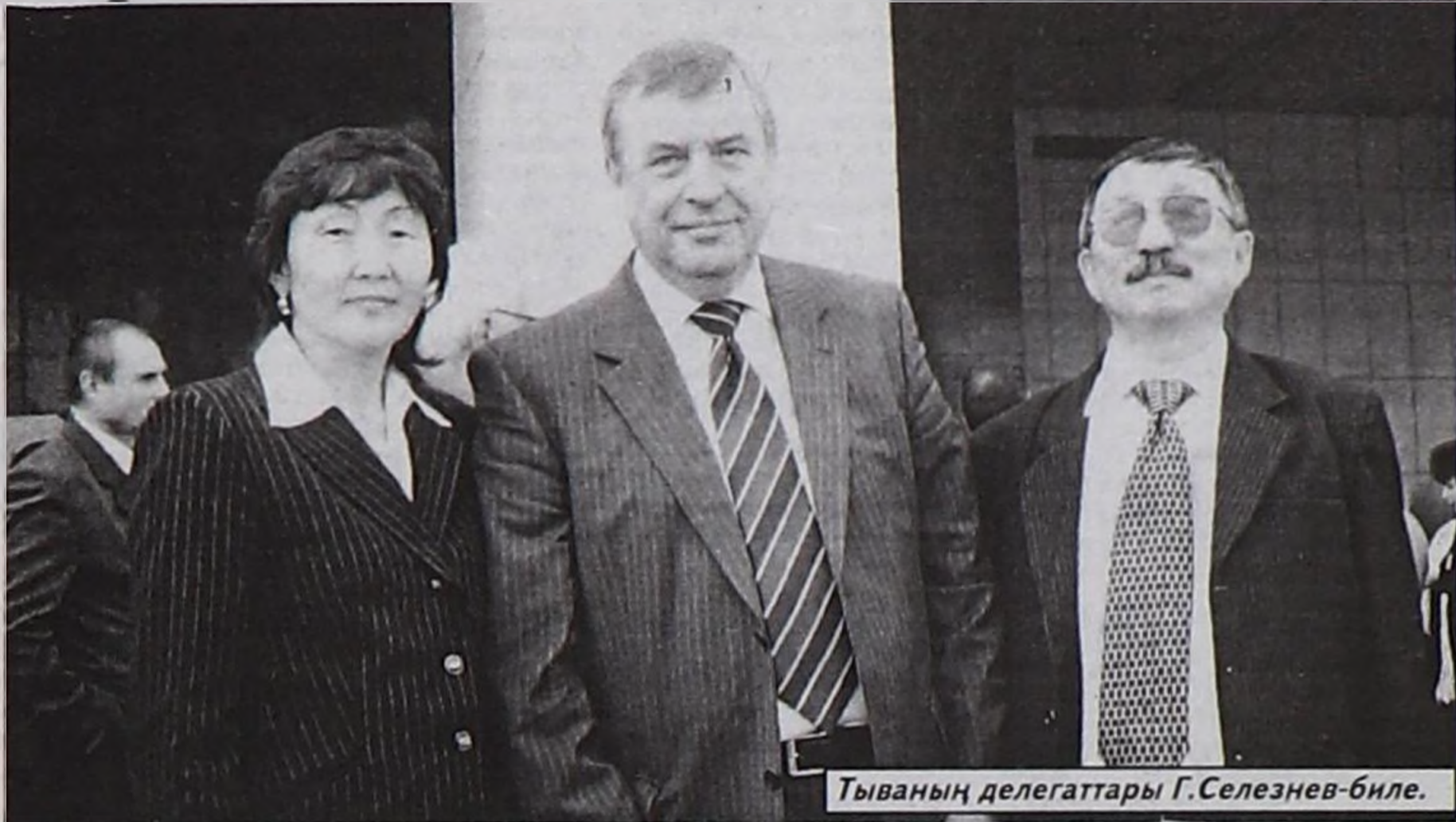
Тываның делегаттары Г.Селезнев-биле.

Сентябрь 24-те Москвага «Россияның патриоттары» политиктиг партияның VII дугаар элчег чок съездизи болуп эричкен. Партияның даргазы Геннадий Семигинниң чугаазы-биле алырга, Россия Федерациязы амгы делегейде эң-не сайыраңгай чурттарның бирээзи болуп уjurлуг. Ынчалза-даа бо хүнде чаңгыс-даа партия мону канчаар чедип алырының тодаргай аргаларын айтыркан модельди саналдап шыдаваан. А ыңдыг болурунун бүгү аргалары бар. Харын-даа улуг күрүнеге шак ыңдыг улуг сорулга ыяал-ла турар уjurлуг деп Геннадий Семигин демдегеп турар. «Россияның патриоттарының» программасында үстүнде чугаалааныыс улуг сорулганы чедип алырының тодаргай, чаа көрүш-биле сиңниккен базымнарын айтыркан.