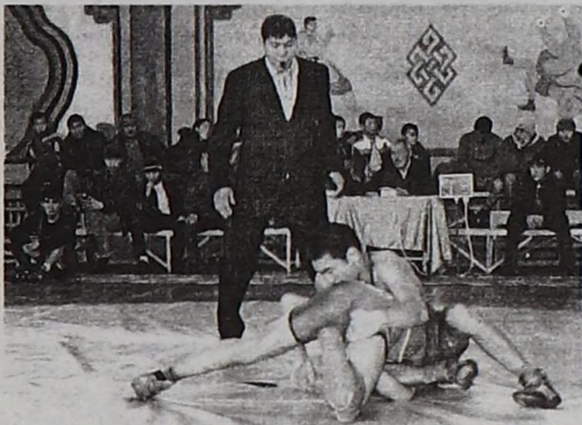
Хевис кырында чидиг демиселдер.