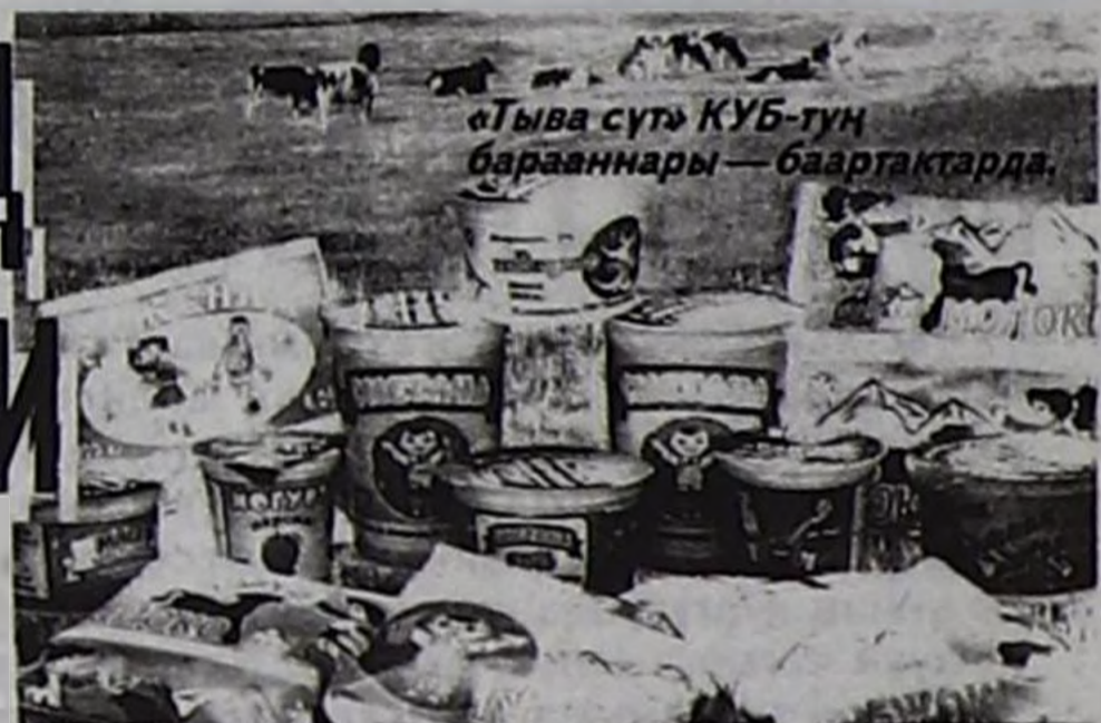
«Тыва сүт» КУБ-тун барааннары — баартактарда.