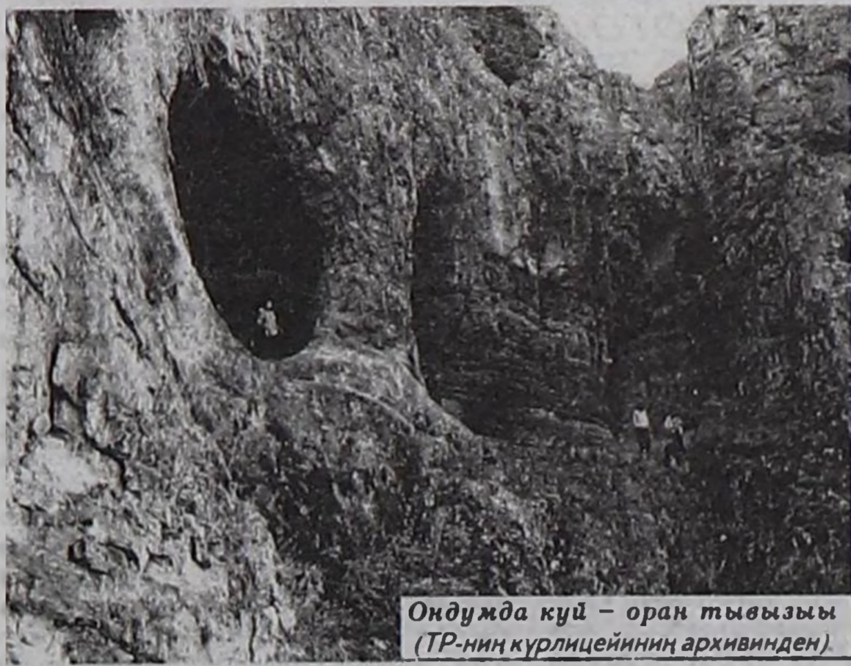
Ондумда күй – оран тывызы