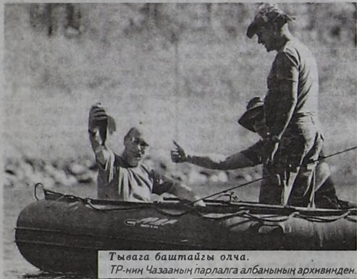
Тывага баштайгы олча. ТР-ниң Чазаның парлалга албанының архивинден.

Бо хүндүлүг аалчыларның аян-чоруунун соонда, республикага иштики-даштыкы туристерниң сонургалы улгаткан. Моон сонгаар ол күзээшкиннер чүгле өзер. Шынап-ла, Тывавыста улуска көргүзүптер солун черлер-ле хөй болгай. Чүгле сөөлгү үеде делегейде билдингир апарган Пор-Бажыңы безин чугаалаарга четчир, а херек кырында чүгле ыңдыг буруңгу уйгур шивээлер орну безин республикада 16 болгай.