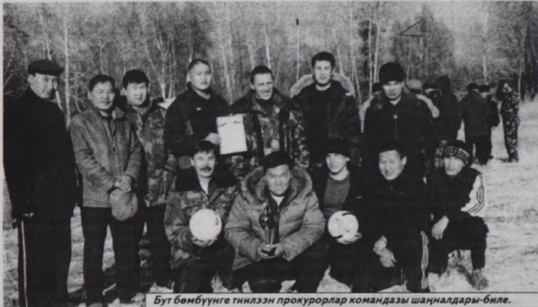
Бут бөмбүүгө тирилген прокурорлар командасы шаңналдары-биле.

Тываның прокуратура ажылдакчылары спортчу маргылдааларны эрттирген. Тыва Республиканың прокуратура ажылдакчылары биле Россия Федерациязының прокуратуразының чанында Истелге комитетинин Тыва Республикада Истелге эргелелинин истекчилери бут-бөмбүү ойнаарына күүжү, мергежилни шенешкен. Прокуратура ажылдакчылары истекчилерден мергежилдиг болгаш эки ойнааш, истекчилерни 2:0 санга удуп алган. Бут-бөмбүүнүн талазы-биле шилчир кубокту прокуратура ажылдакчыларының командасының капитаны Танды