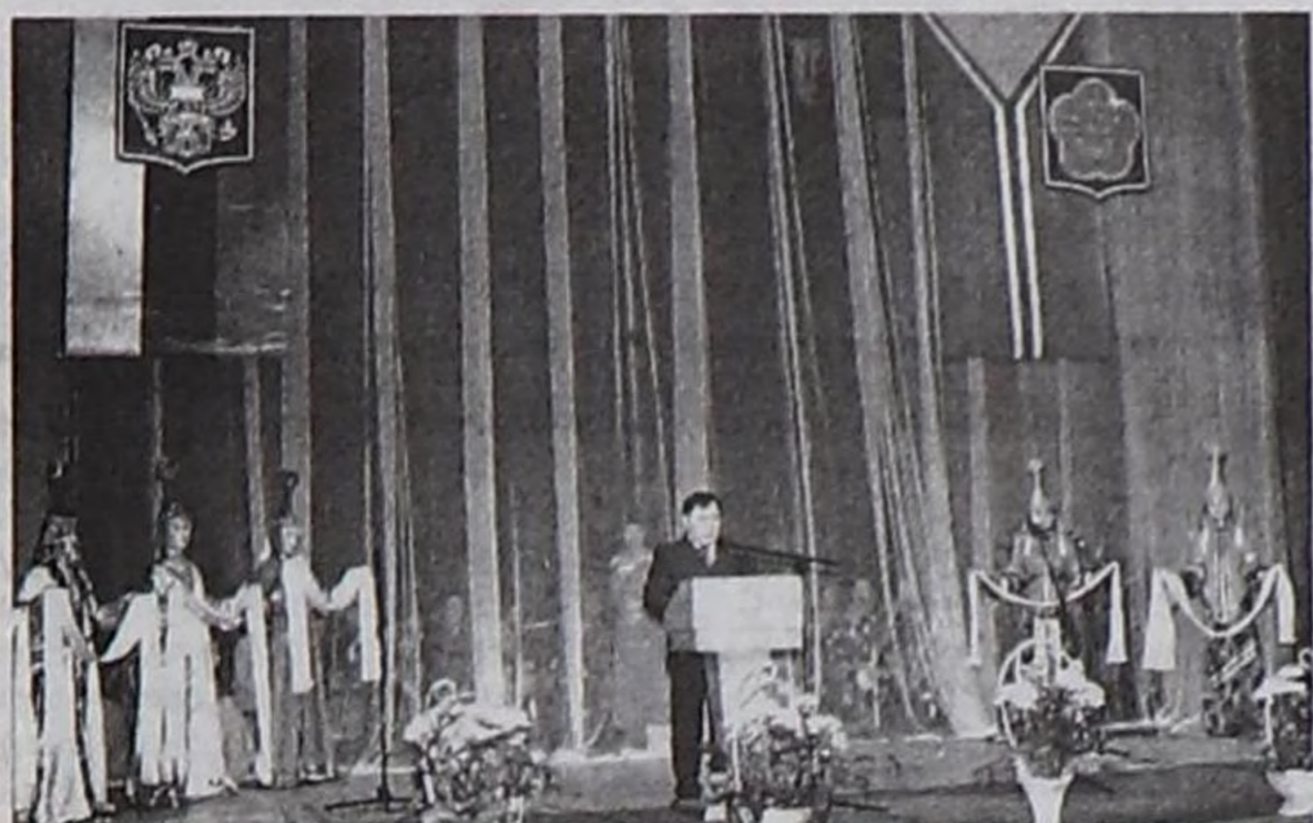
Республиканың хөгжүм-шии театрына Тыва Республиканың Чазааның Даргазы Ш.В. Кара-оолдун бедик албан-дужалдың дүжүлгезинге олurarының байырлыг езулалының үезинде.