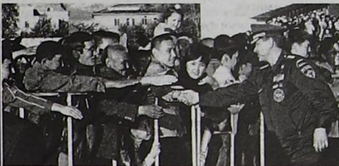
Россияның Маадыры С.К. Шойгунуң чон-биле ужуражылгазы.