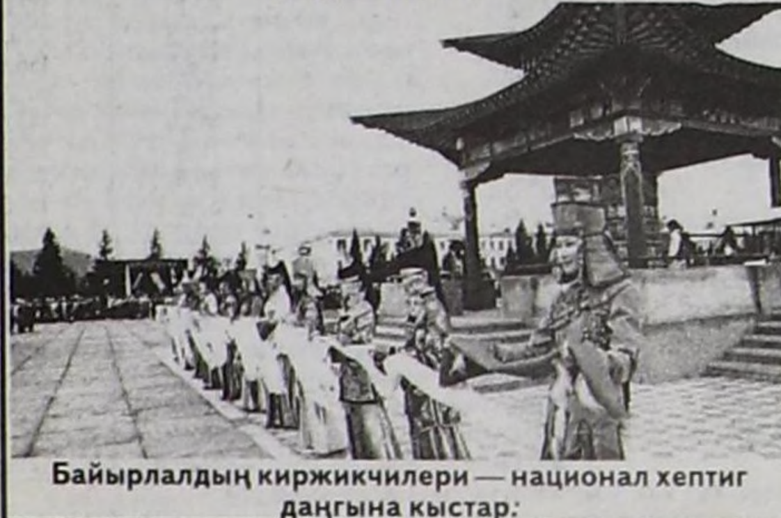
Байырлалдың киржикчилери — национал хептиг даңгына кыстар.