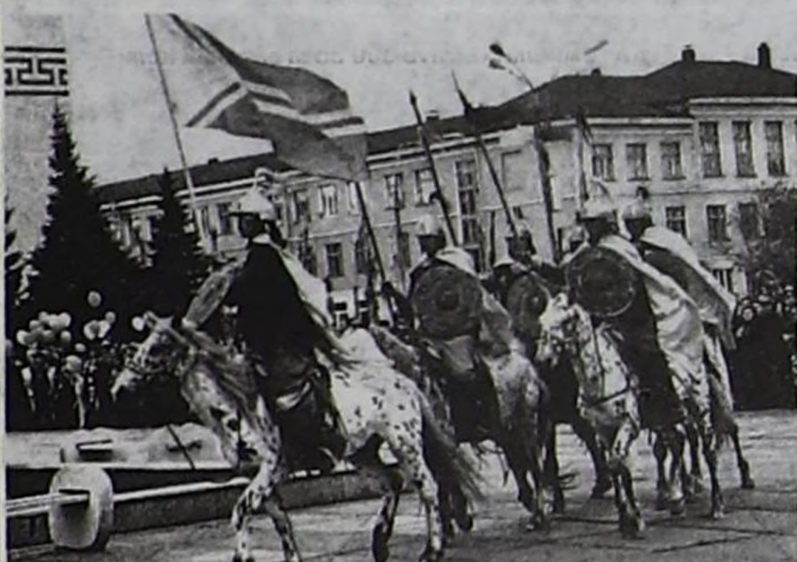
Сылдыс-шокар аъттарлыг тоолчургу дайынчылар Арат шөлүнгө үнүп келген.