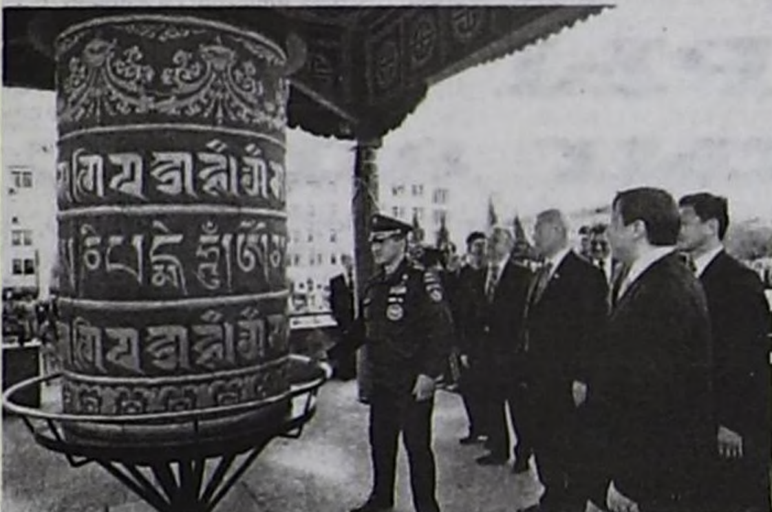
Армия генералы С.К. Шойгу, Алтай, Бурят республикаларның, Красноярск крайның төлээлери Мани хүртүзүн долгап турары.