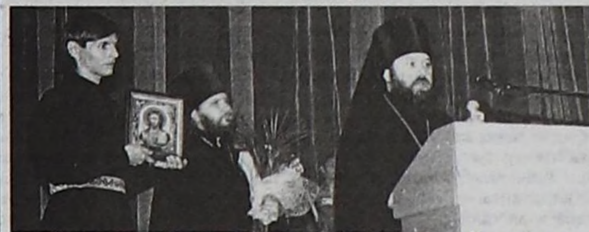
Кызылдың болгаш Абаканның Епискову Иконофан байыр чедирген.