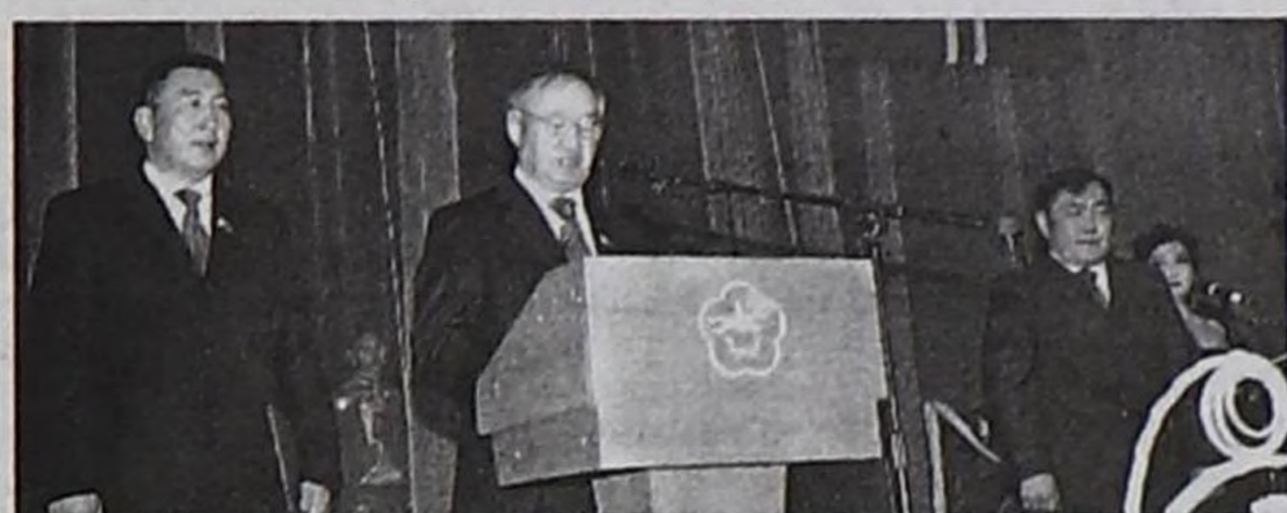
Тыва Республиканың Улух Хуралының палаталарының даргалары Х.Д. Монгуш биле В.М. Оюн ТР-ниң Чазак Даргазы Ш.В. Кара-оолга байыр чедирип турары.