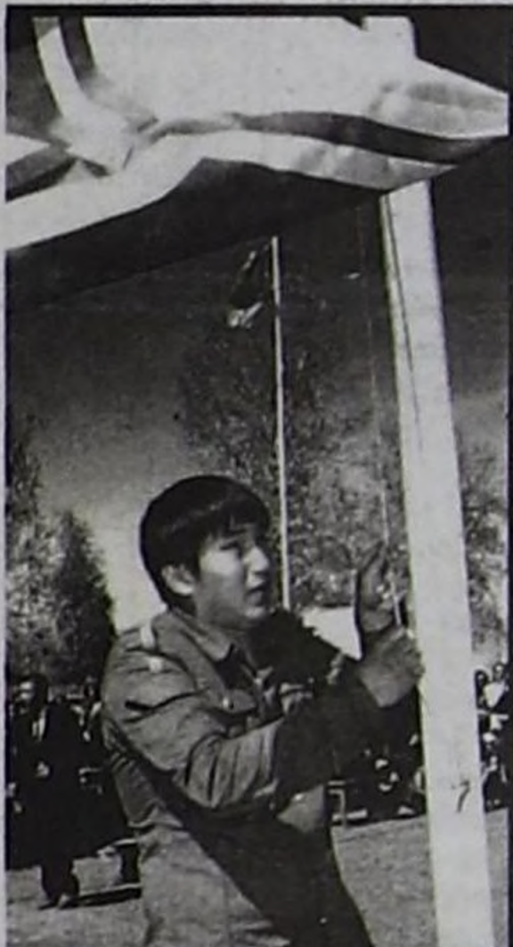
Дайынчының оглу спортчу маргылдааларның ажыдышкынынга Күрүне тугун көдүрүп турары.