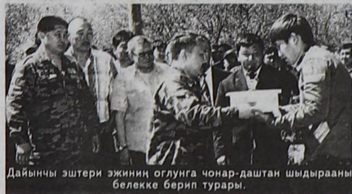
Дайынчы эштери эжиниң огулунга чонар-даштан шыдырааны белекке берип турары.