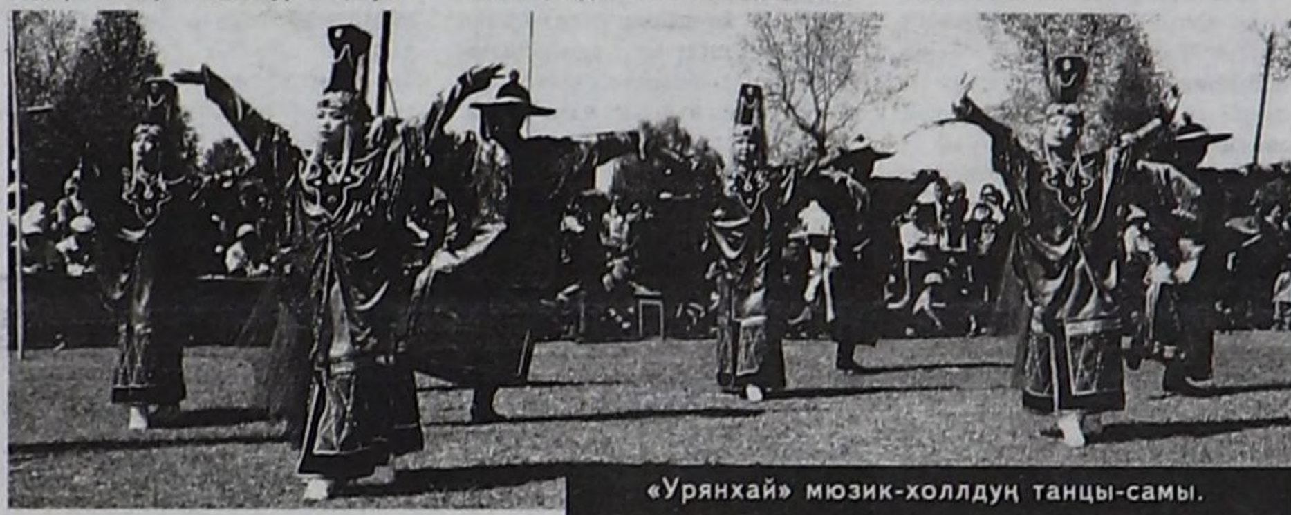
«Урянхай» мюзик-холлдуң танцы-самы.

О.Ю. Кожага өг-бүлезинге ортун оглу болуп, 1965 чылдың июнь 6-да Улуг-Хем (Чаа-Хөл) районнун Булуң-Терек суурга төрүттүнген. Булуң-Терек ортумак школазынга 1971-1972 өөредилге чылында белеткел «а» клазынга өөренип