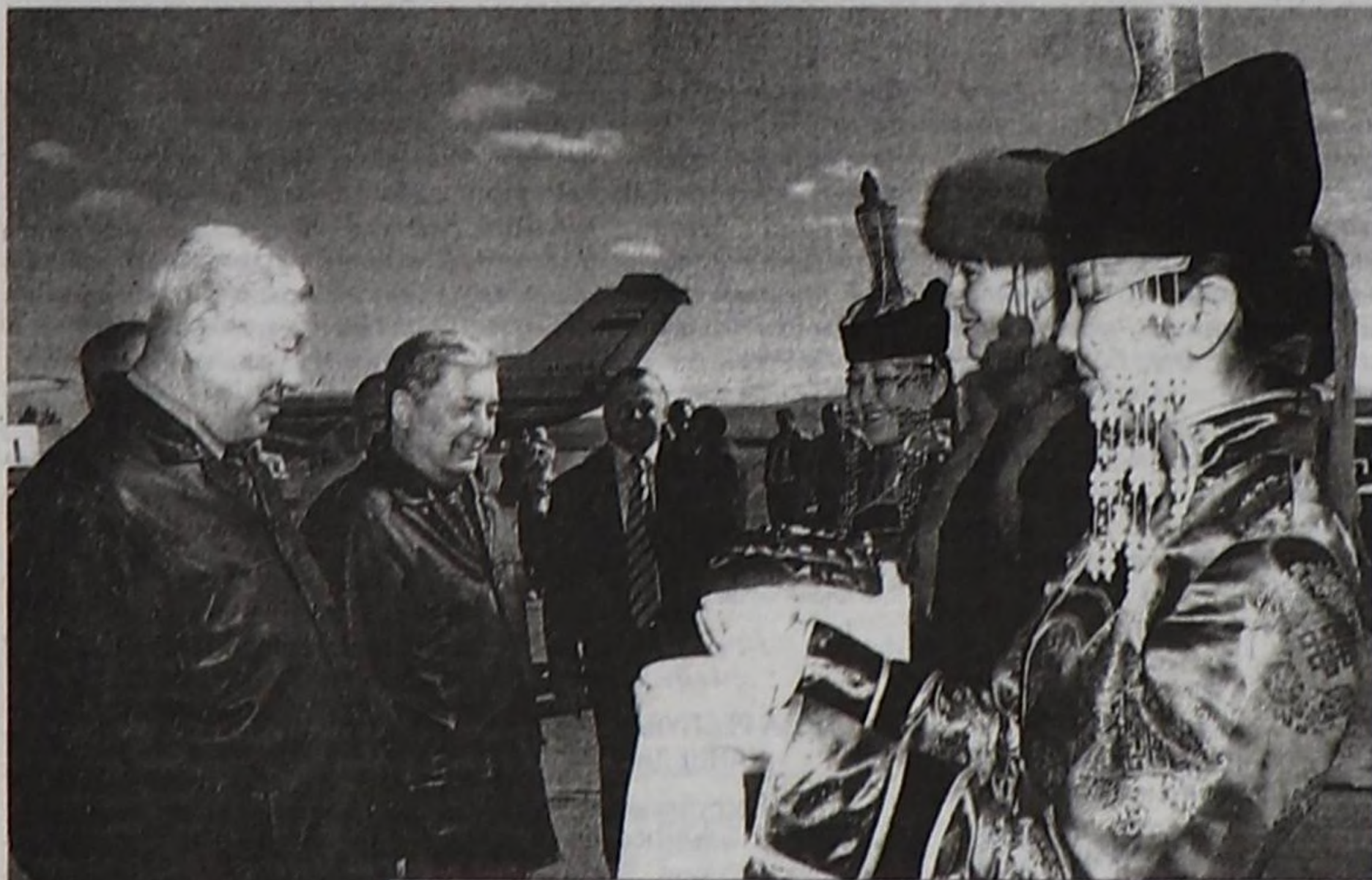
Бурят Республиканың делегациязы Кызылдың аэропортунда.

Тыва Республиканың Чазааның Даргазы Ш.В. Кара-оолдун дүжүлгезинге олурарының май 18-те болур байырлыг езулалына киржири-биле Сибирь регионундан чалаттырган делегациялар кээп эгелей берген.