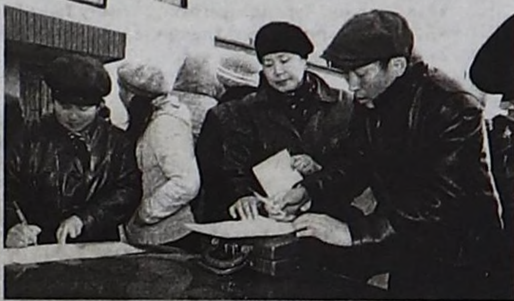
(Уланчызы. Эгези 1-ги арында).

негелдеге дүүштүр дерип экижидери, ажыл-чорудалгазын чурумчудары арткан дээрзин Россияның Хереглечкилер хайгааралының ТР-де эргелелиниң контроль болгаш хайгаарал килдизиниң специалистериниң база Россияның Үндүрүг албарының ТР-де эргелелиниң ажилдакчыларының март 28-те найысылалда «Мажалык» рыногунга массалыг информация чепсектериниң төлээлериниң киржилгези-биле чорутканы хыналда ажылынга киришкеш, билип алдым.