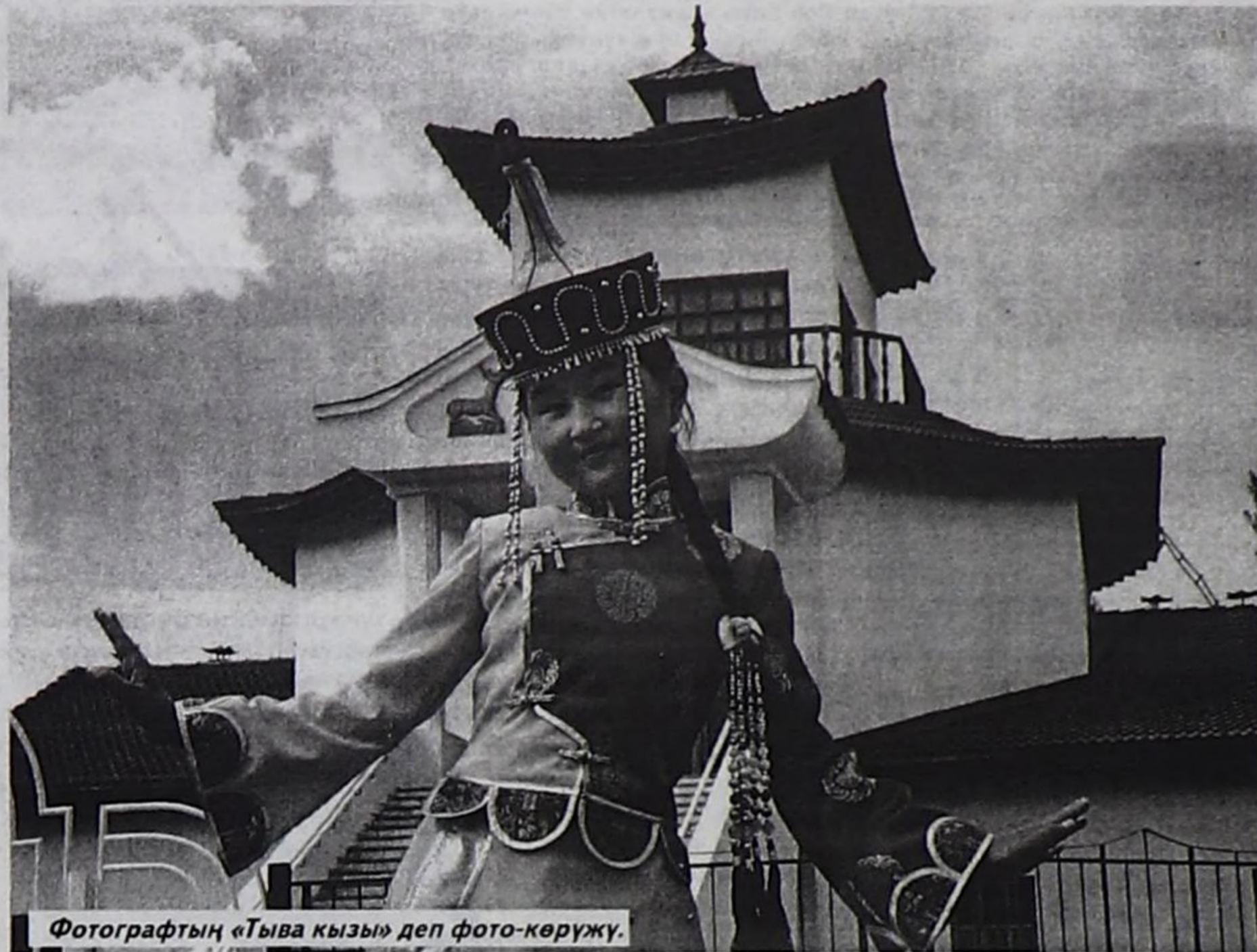
Фотографтың «Тыва кызы» деп фото-көрүжү.