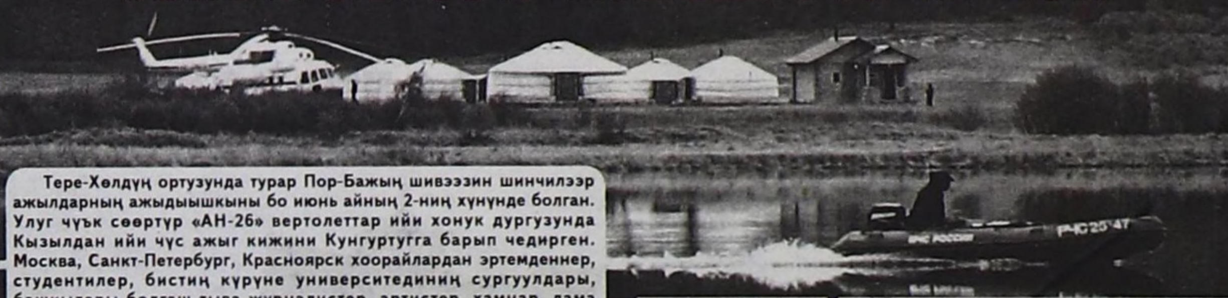
Тере-Хөлдүн ортузунда турар Пор-Бажың шивээзин шинчилээр ажилдарның ажыдышкыны бо июнь айның 2-ниң хүнүнде болган. Улуг чүк сөөртүр «АН-26» вертолеттар ийи хонук дургузунда Кызылдан ийи чүс ажыг кижини Кунгуртугга барып чедирген. Москва, Санкт-Петербург, Красноярск хоорайлардан эртемденнер, студентилер, бистиң күрүне университетиниң сургуулдары, башкылары болгаш тыва журналистер, артистер, хамнар, лама башкылар дээш өске-даа аалчылар аңаа арбыны-биле киришкен.