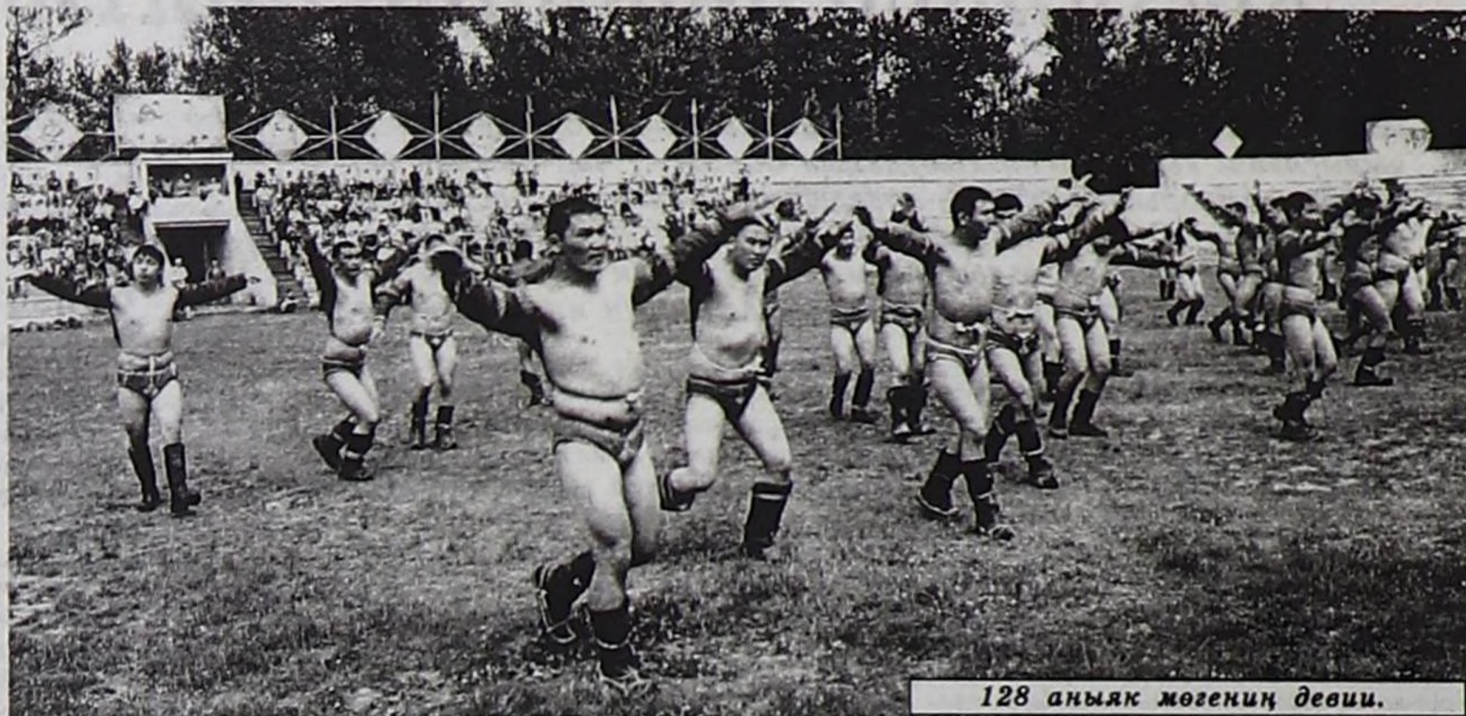
128 аныяк мөгениң девиги.

давайн турар. Аныяктарның хүрежин көрүп олурарга, тыва хүрештиң келир үезинге, олардан кончуг шыырак мөгелер үнеринге бүзүрел кижини чайгаар-ла хөмө ап келир. Амгы үениң аныяк мөгелери 1970-80 чылдарның арай бичежек мөгелери дег эвес, барык хөй кезини узун, делгем, деңзизи база аар, эът-хан талазы-биле кончуг чедишкен, мөчөк,