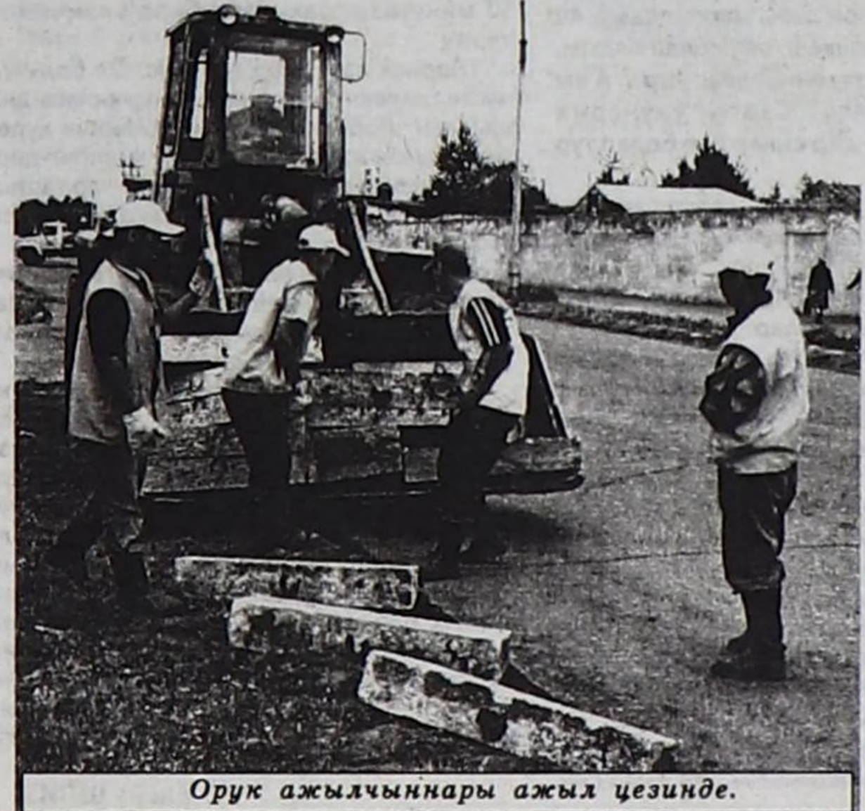
Орук ажылчынарны ажил цезинде.

13.06.07 ч. РЕДАКЦИЯДАН. Чагааны эдилге чок парладывыс. Бо анык кижиге Таңды, Бай-Тайга кожууннарның ЗАГС черлери огулуг харыыны бээр дээрзинге бүзүредивис.