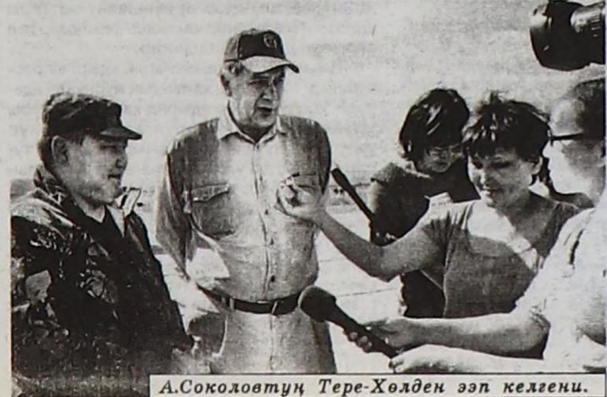
А.Соколовтуң Тере-Хөлдөн эеп келгени.

Чурукта: хурал үезинде.