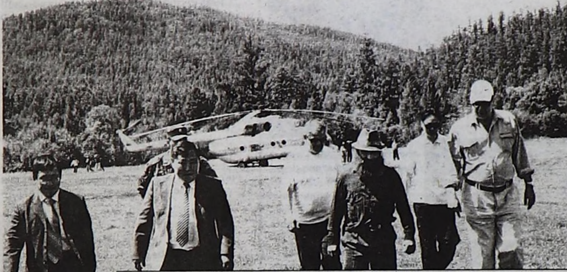
Хүндүлүг аалчыларны Катазыга Пермьковтуң уткуп алганы.

Россия Федерациязының культура болгаш массалыг коммуникациялар сайыды Александр Соколов Тере-Хөл кожуундан эеп келгеш бодунуң магадалын чажырбаан: «Кайгамчыктыг кызыл хүн хаяазы, чугаалап ханмас даң хаяазы. Элдептиг дээр!» – деп, Тываның агаар-бөйдузун чугаалап ханмаан. «Пор-Бажың» Хайгаарал Чөвүлелиниң кежигүнү, федералдыг сайыттың Тывага ийи хонук дургузунда келген ажил-албанының программазы Пор-Бажың шивээзинде археологтуг казыышкынның чорудуун барып көрүп танышканы-биле доозулган.