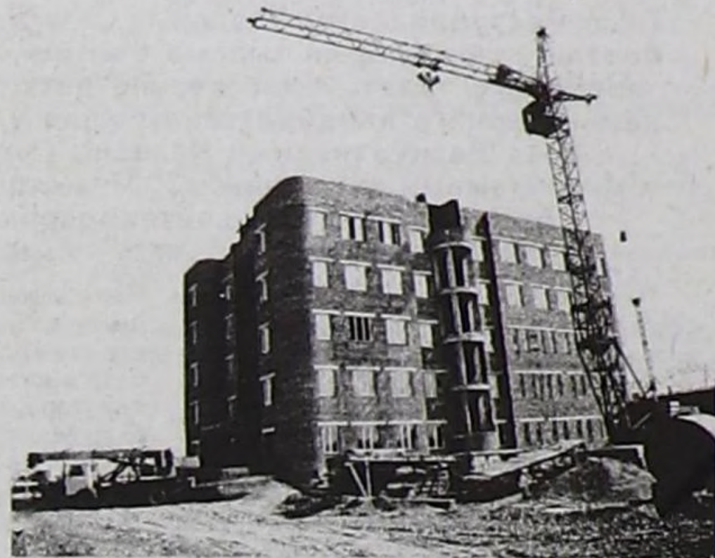
Дээди судтуң тудуунуң ниити хевир.