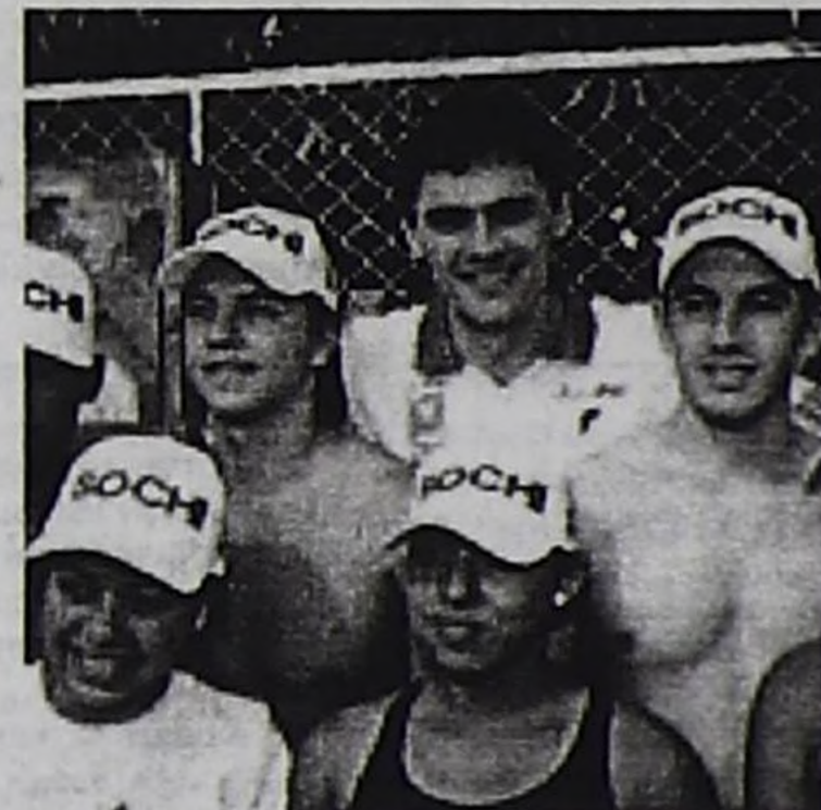
Олимпий оюннарының 4 дакпыр чемпиону Александр Попов Гватемаланың бөлүк оолдары-биле.

Черле ынчаш, Олимпиада – бүгү чурттарда улуг инфраструктура төлөвилелдери боттандыраарыга улуг идиг болуп турар. Чижээ, Сочице кыска хуусааның иштинде болдунмас чүүлдерни кылган. Бо хонуктарда спортчу объектилерниң төлөвилээшкени доозулган, хей «сылдыстыг» аалчылар бажыңнары туттунуп эгелээн. Чаа электри подстанциязы, газ дамчыдыкчызының оруу, чер адаанда (!) ГЭС, делегей чергелиг аэропорт болгаш чылда 4 миллион чедир туристер хүлээп алыр аэровокзал комплекзи дээш, он-он чаа объектилер туттунуп турар. Сочиниң рейтингизи делегей агентилелдериниң медээлеринге сөөлгү каш айлар иштинде дыка өскеш, кол удурланкчылары турган Зальцбург биле Пхенчханга деннежи берген турган. ДОК-туң каш хонук бурунгаар болган түннел бадылаашкыннары ооң мырыңай өзе бергенин бадыткаанын үстүнде барымдаалардан көрдүс. Ынчалза-даа Сочиниң мурнунда экология, олимпийжи объектилерни газ болгаш электри энергиязы-биле долу хандыраарының айтырылганы турар. Ындыг-даа болза, күрүнениң талазындан ол