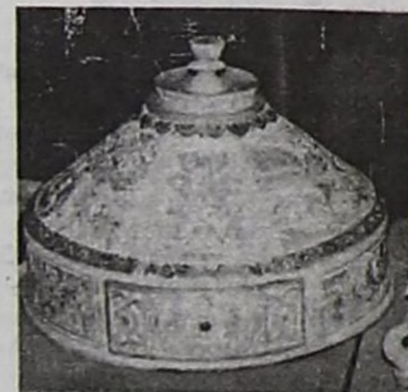
«Буддизм философиязының өө» деп ажилы.

кижилер үнген, салгакчыларынга ол чоргаарланыр.