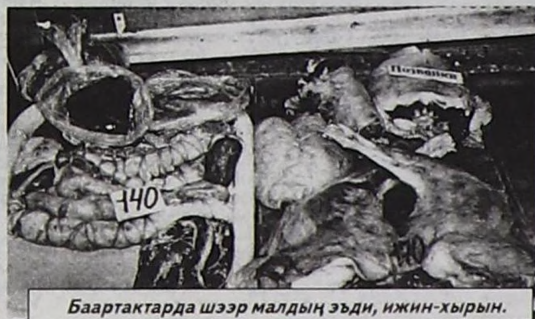
Баартактарда шээр малдың эди, ижин-хырын.