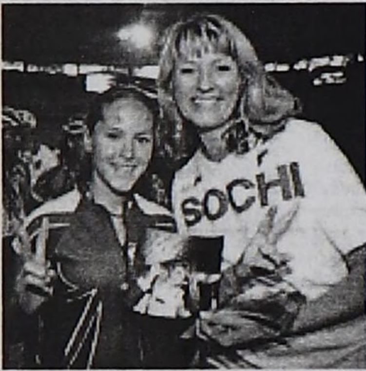
Конькиге маңаарынга Олимпий оюннарының чемпиону Светлана Журова.

бурунгаар бо «марафонга» Сочиниң белеткелин «эки» деп олимпийжи комитеттиң кежигүннери демдегелеп турган. Ол-ла үеде өске ийи удурланкчыларга «тулган эки» демдектерни салганнар. Чижээ, Англияның «Вильям Хилл» дээр букмекер конторалары Пхенчханның теригидеки деп санааш, чурттуң ойнакчыларының аразынга хей адаанныг оюннары организастан. Ынчалза-даа сөөлгү шиитпирлиг хүнде Делегейниң олимпийжи комитетинге Сочиниң таныштырылганың үезинде РФ-тиң Президентизи Владимир Путиниң орус, англи болгаш француз дылдарга арыг болгаш сеткил-сагызы хайнышкынның чугаазы Сочиниң тиилелгезинге улуг рольду ойнаан. Австрияның премьер-министри болгаш спорттуң сайыды Альфред Гузенбауэрниң болгаш Мурнуу Кореяның Президентизи Но Му Хенниң чугаалары улустан сонургалын улуг-ла хайныктырбаан. Көрей удурткучу мырыңай төрөөн дылдынга чугаалаан.